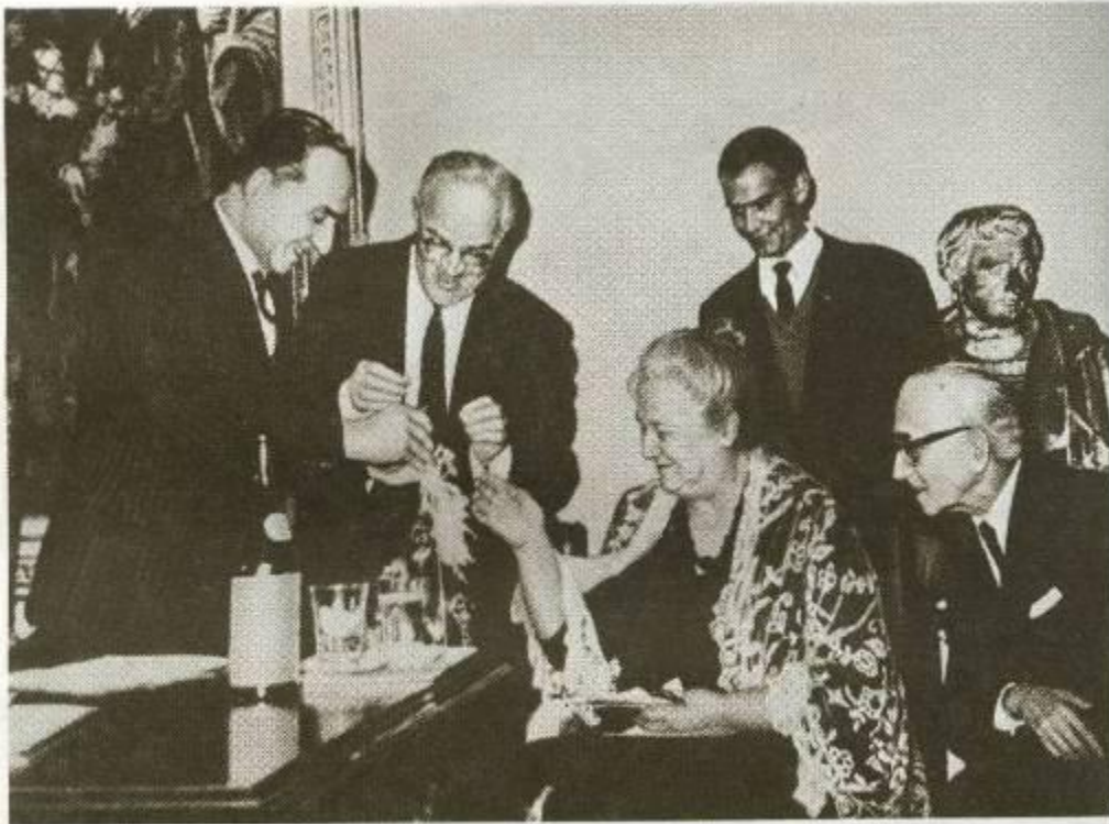
ЦЕРЕМОНИЯ ВРУЧЕНИЯ АННЕ АХМАТОВОЙ МЕЖДУНАРОДНОЙ ЛИТЕРАТУРНОЙ ПРЕМИИ «ЭТНА-ТАОРМИНА». ИТАЛИЯ. 1964