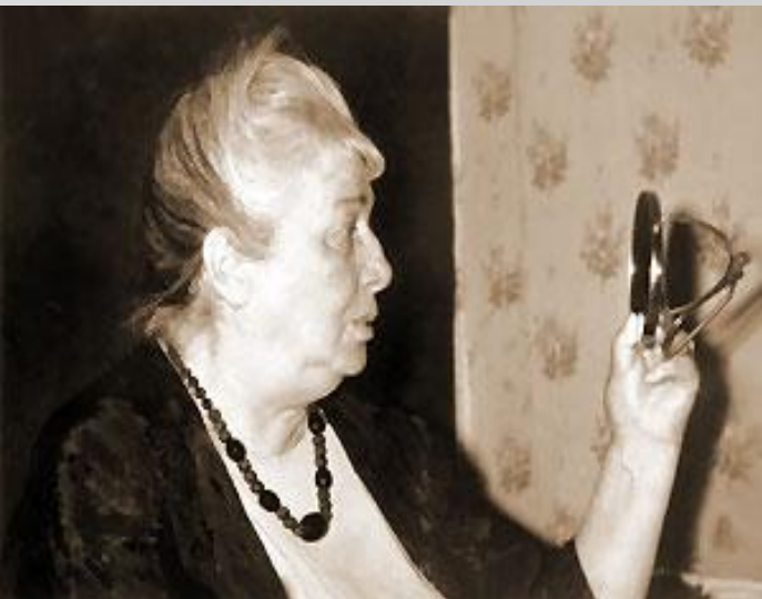
Ахматова в последние годы жизни.

Ахматова с друзьями, которые не оставляли ее никогда, даже в самые тяжелые минуты жизни.