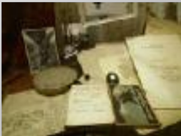
Рукописи, фотографии и другие личные вещи Ахматовой.