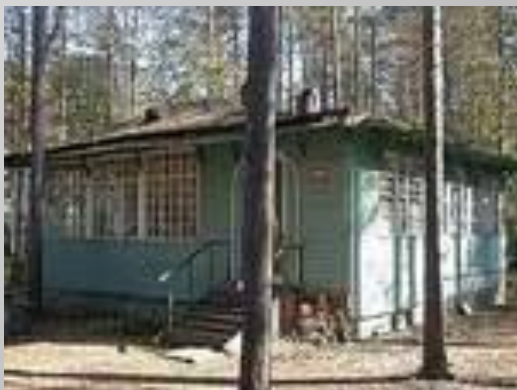
Дача Анны Ахматовой в Комарове.