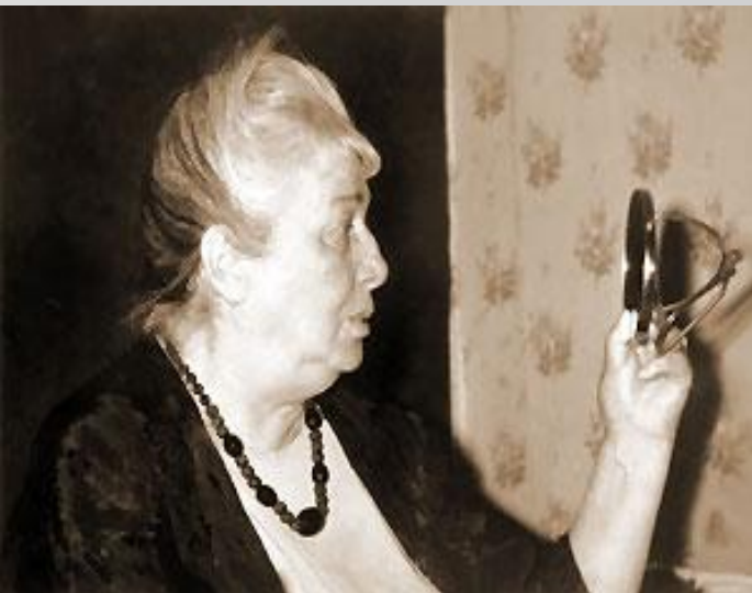
Ахматова в последние годы жизни.

Ахматова с друзьями, которые не оставляли ее никогда, даже в самые тяжелые минуты жизни.