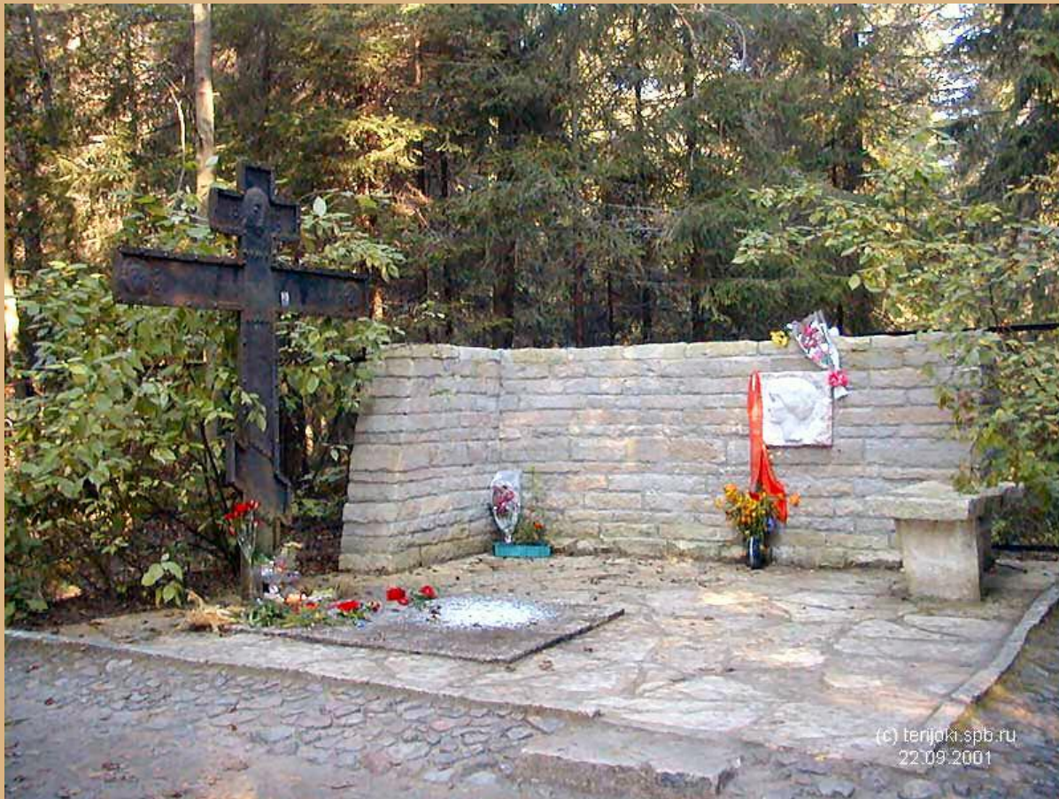
Могила Анни Ахматової