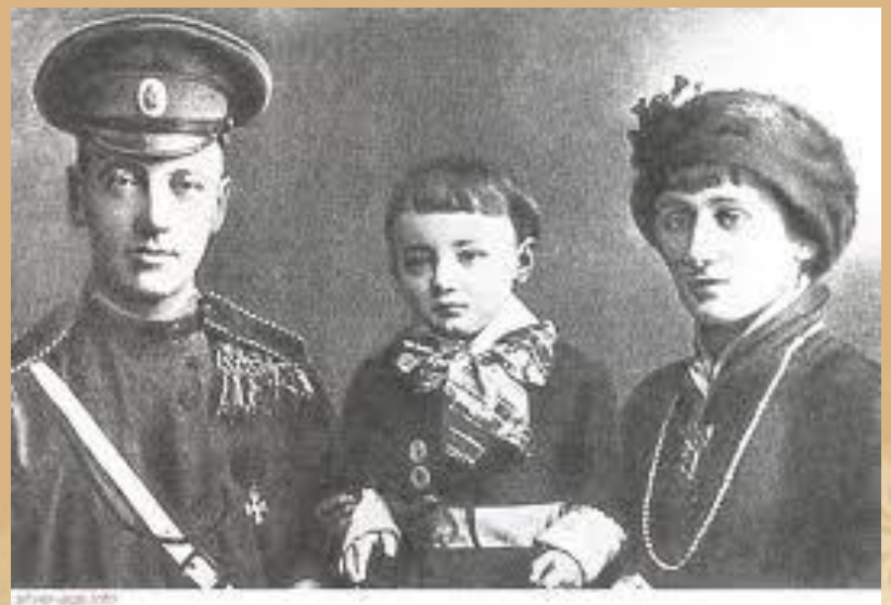
Микола Гумільовий, син Лев, Анна Ахматова