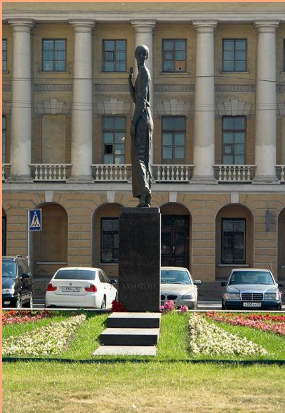
Памятник Анне Ахматовой на Смолярной набережной