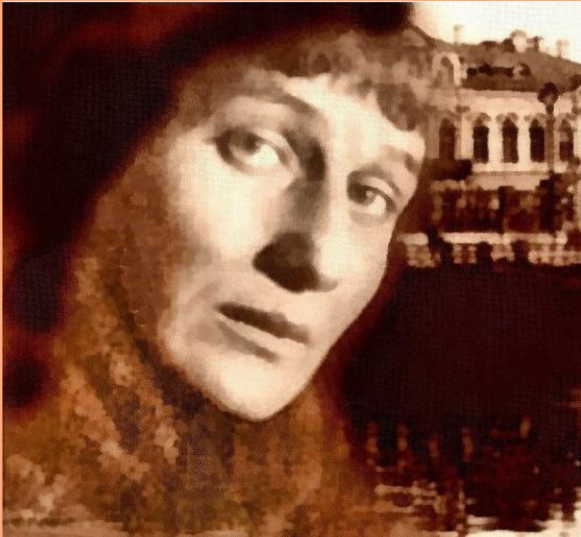
Анна Ахматов а