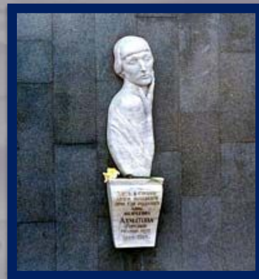
Одесса. Мемориальная доска Ахматовой

Мои первые воспоминания - царскосельские: зеленое, сырое великолепие парков, выгон, куда меня водила няня, ипподром, где скакали маленькие пестрые лошадки, старый вокзал и нечто другое, что вошло впоследствии в "Царскосельскую оду".