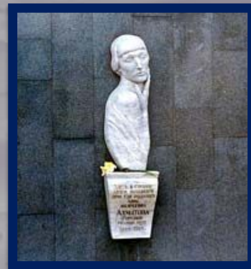
Одесса. Мемориальная доска Ахматовой

Я родилась 11 (23) июня 1889 года под Одессой (Большой Фонтан). Мой отец был в то время отставной инженер-механик флота. Годовалым ребенком я была перевезена на север - в Царское Село. Там я прожила до шестнадцати лет.