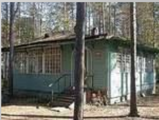
Дача Анны Ахматовой в Комарове.