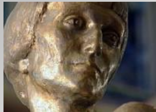
Памятник Анне Ахматовой