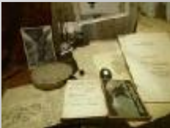
Рукописи, фотографии и другие личные вещи Ахматовой.