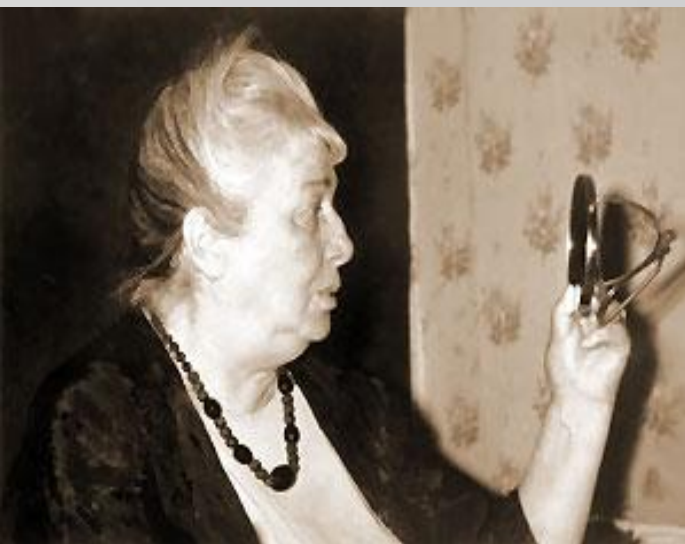
Ахматова в последние годы жизни.

Ахматова с друзьями, которые не оставляли ее никогда, даже в самые тяжелые минуты жизни.