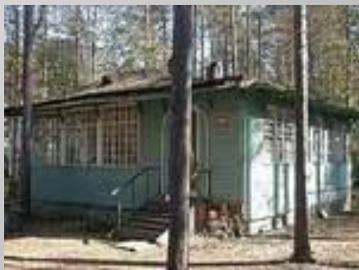
Дача Анны Ахматовой в Комарове.