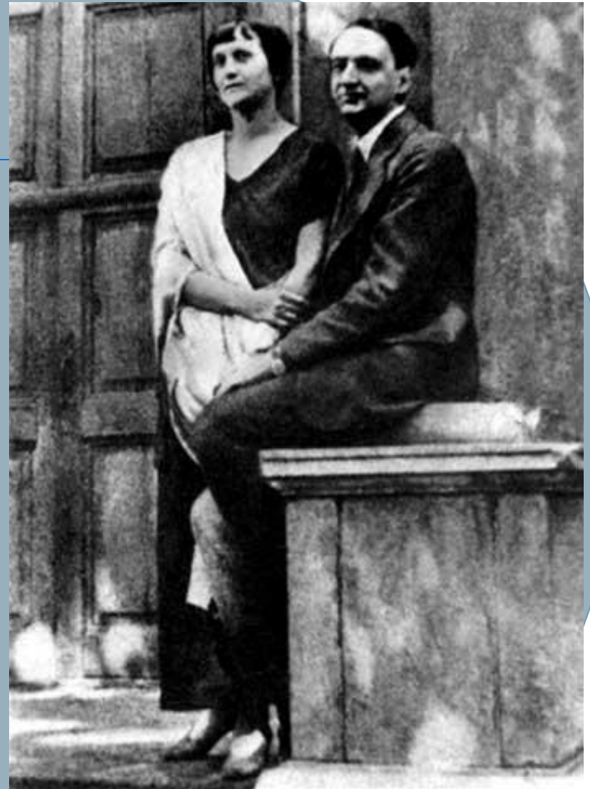
Анна Ахматова и Николай Пунин

Как подарок, приму я разлуку И забвение, как благодать. Но, скажи мне, на крестную муку Ты другую посмеешь послать?