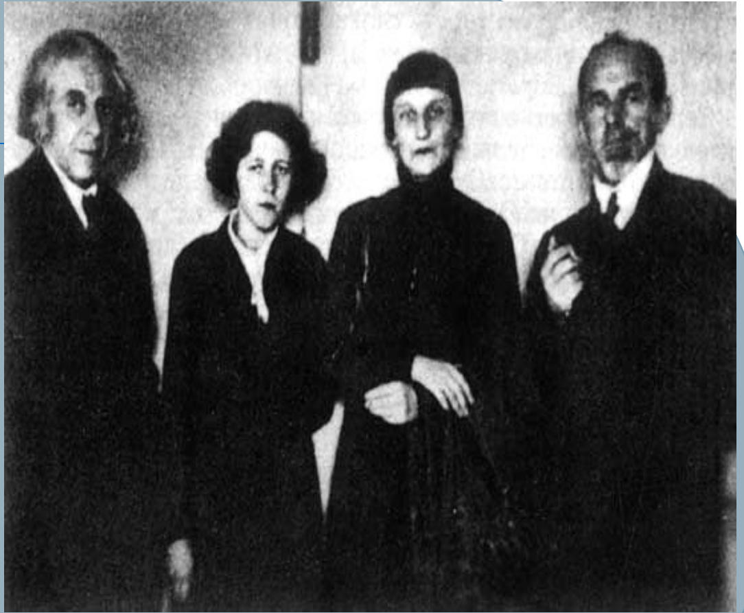
А. Ахматова и О. Мандельштам

В жизни Анны Ахматовой было много мужчин, но никакого любовного треугольника.