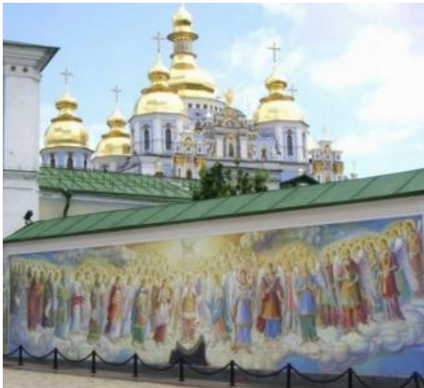
Кієвъ. Михайловскій монастырь. Kiev. L'Eglise de Michailov.