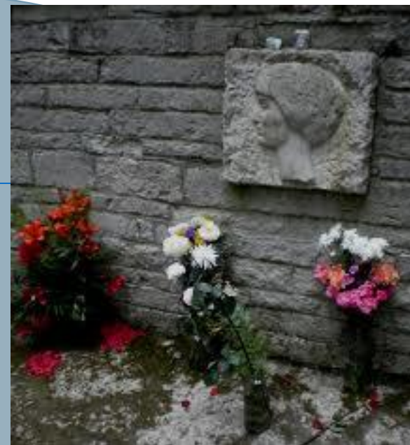
Могила Анны Ахматовой