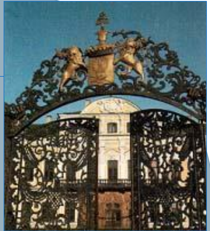
Чугунные ворота Фонтанного дома