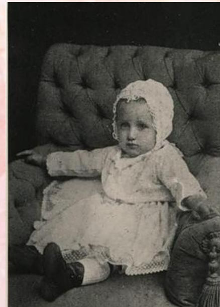
А. Ахматова в детстве