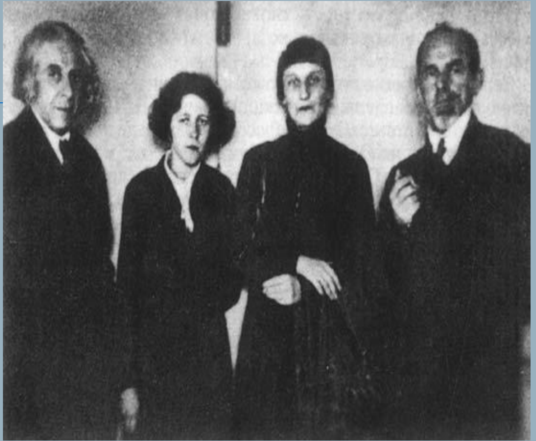
А. Ахматова и О. Мандельштам

В жизни Анны Ахматовой было много мужчин, но никакого любовного треугольника.