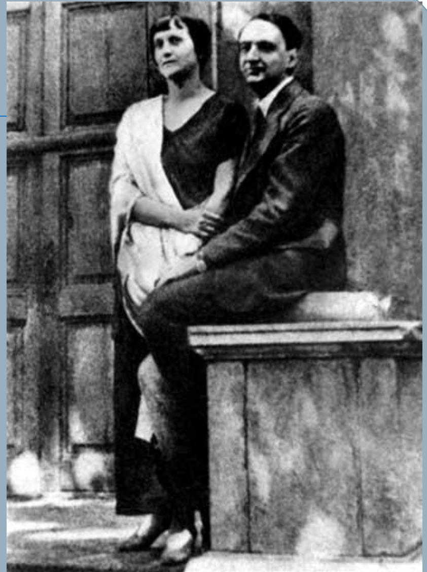
Анна Ахматова и Николай Пунин

Как подарок, приму я разлуку И забвение, как благодать. Но, скажи мне, на крестную муку Ты другую посмеешь послать?