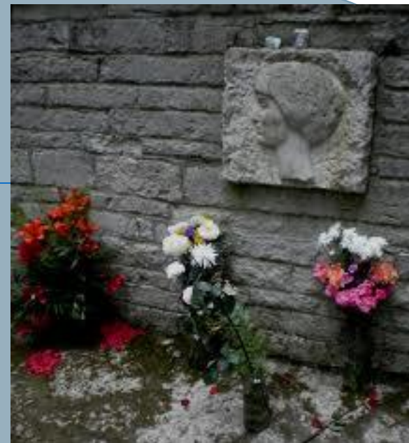
Могила Анны Ахматовой