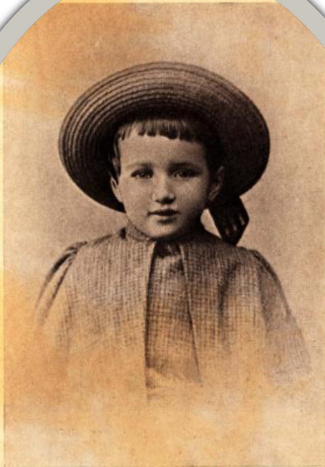
А. А. Ахматова в детстве. 1894

1889г. 23 июня в селении Большой Фонтан близ Одессы родилась Анна Горенко.