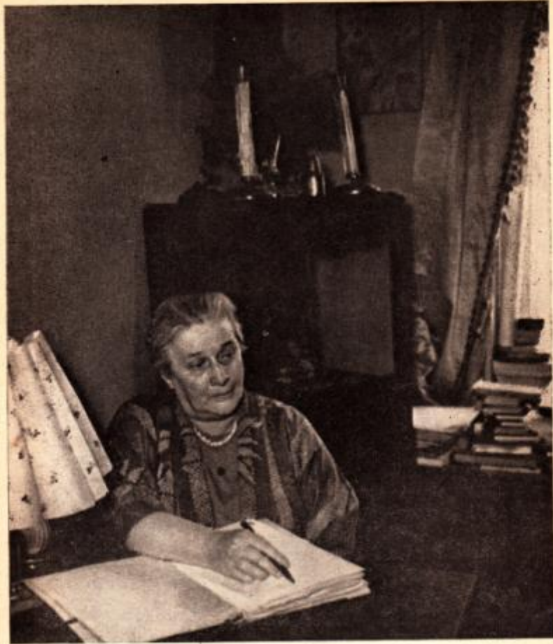
А. А. Ахматова. 1956