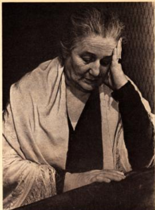
А. А. Ахматова. 1960

В этой жизни я немного видела, Только пела и ждала.