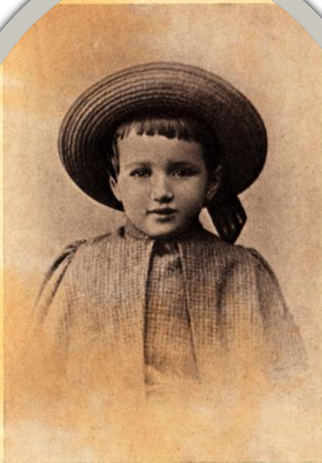
А. А. Ахматова в детстве. 1894

1889г. 23 июня в селении Большой Фонтан близ Одессы родилась Анна Горенко.