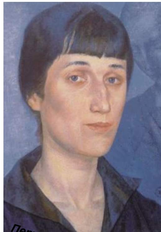
Петров-Водкин К. С. Портрет А. А. Ахматовой. 1922