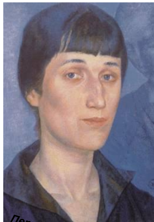
Петров-Водкин К. С. Портрет А. А. Ахматовой. 1922