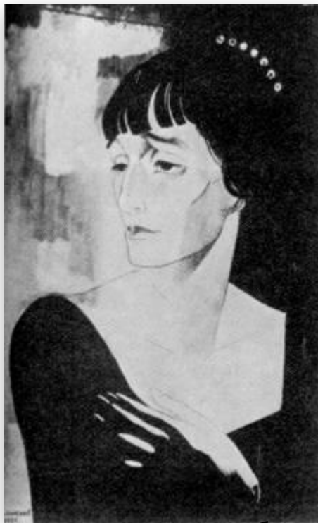
Анненков Ю. П. Портрет А. А. Ахматовой. 1921 Бумага, гуашь