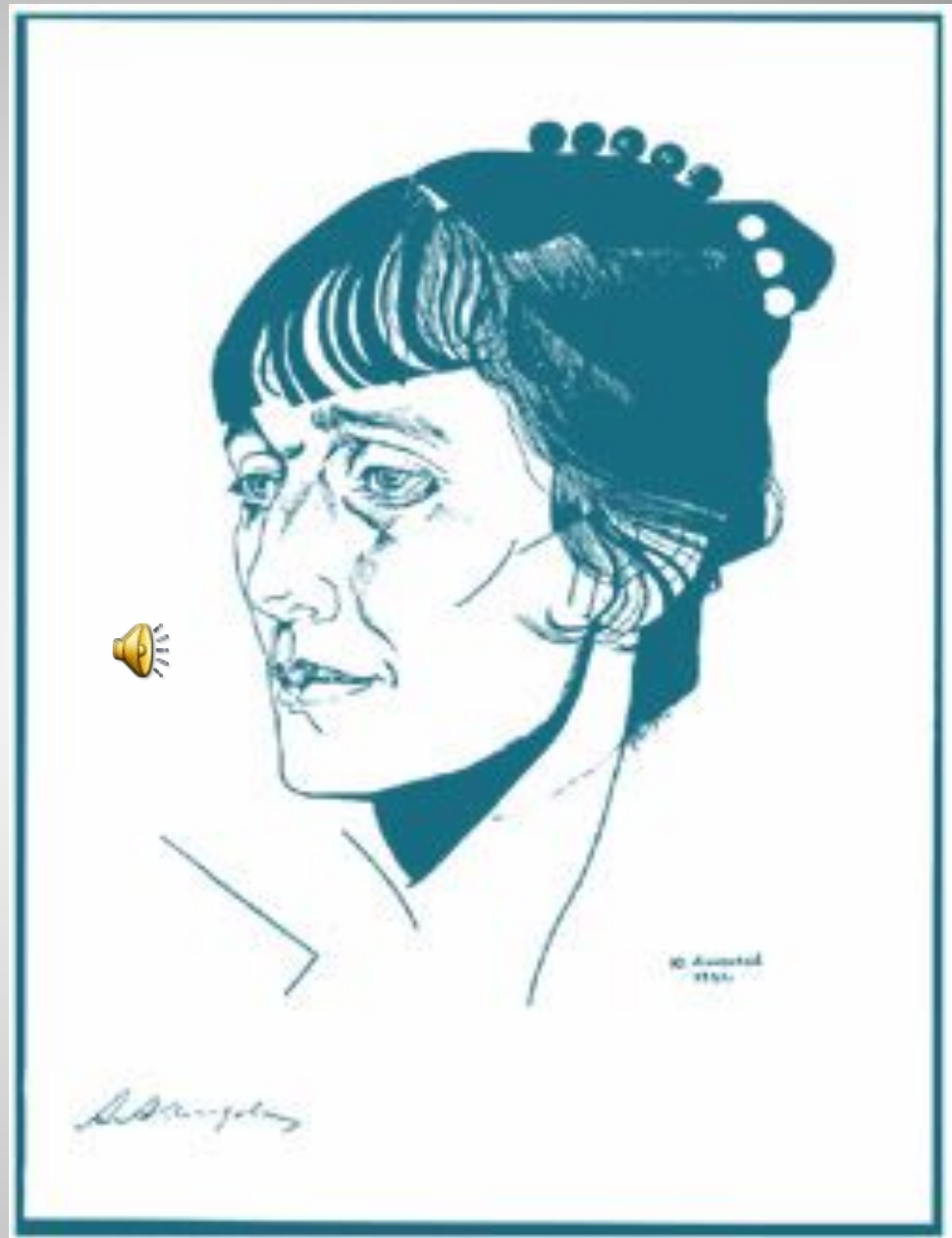
Анна Андреевна Ахматова (Горенко) 1889 -1966