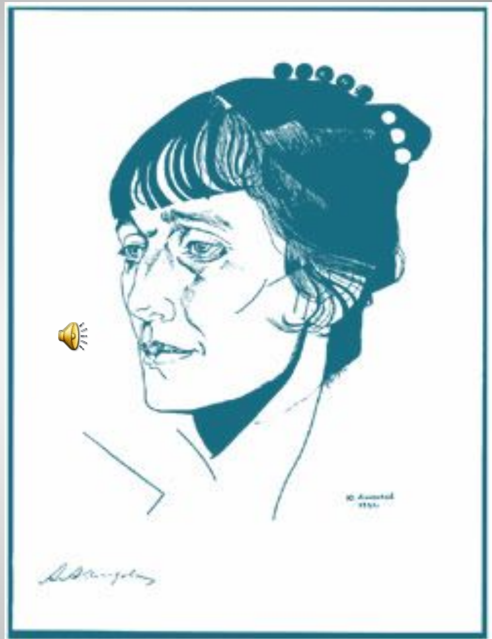
Анна Андреевна Ахматова (Горенко) 1889 -1966