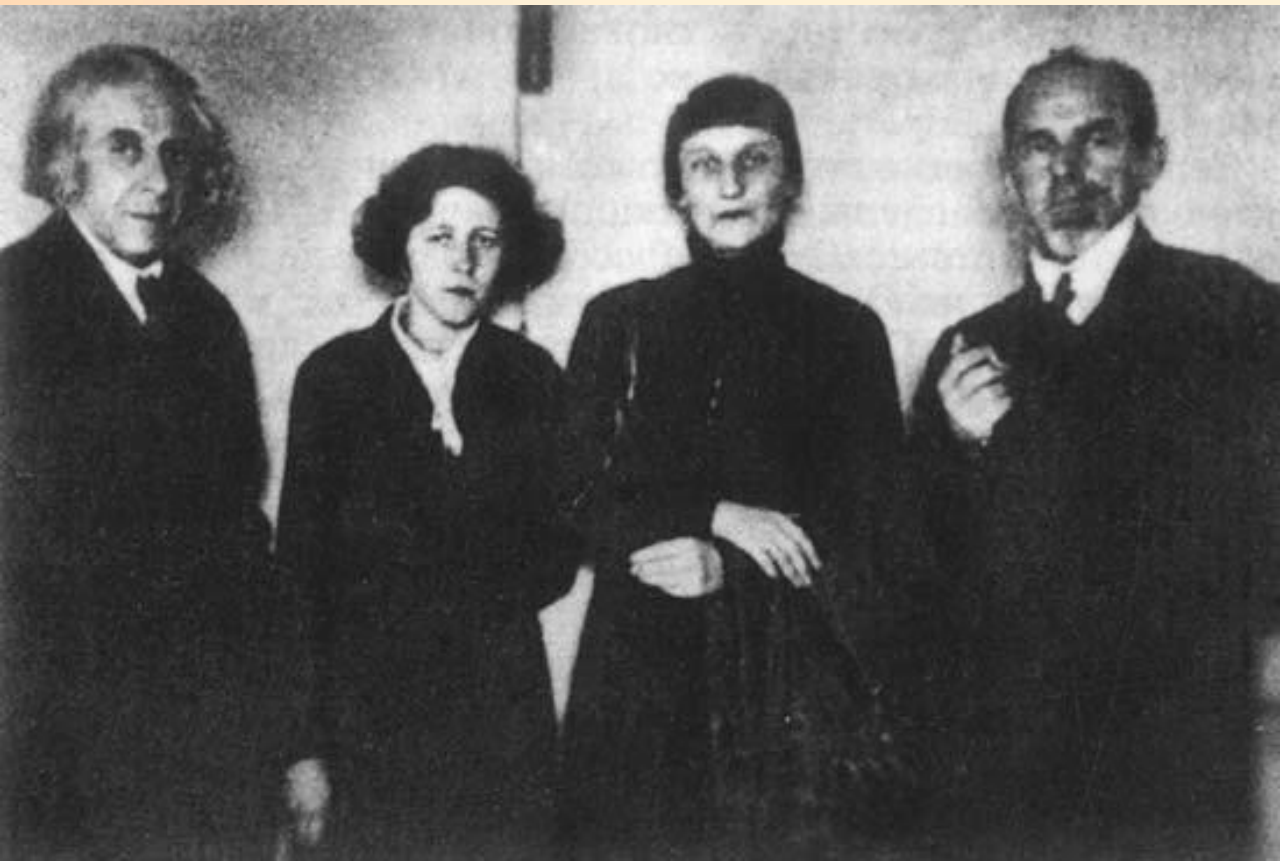
Чулков Георгий, Петровых Мария, Ахматова Анна, Мандельштам Осип