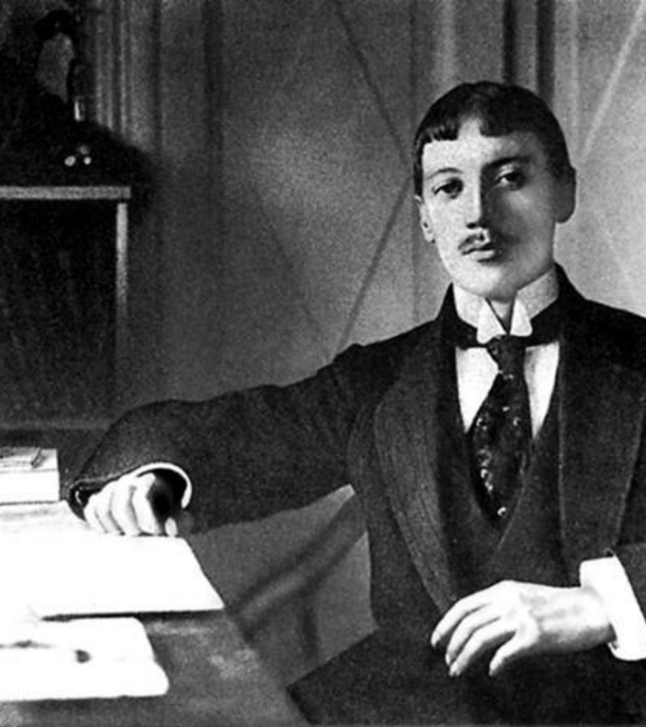
Н. Гумилев. 10-ые годы.