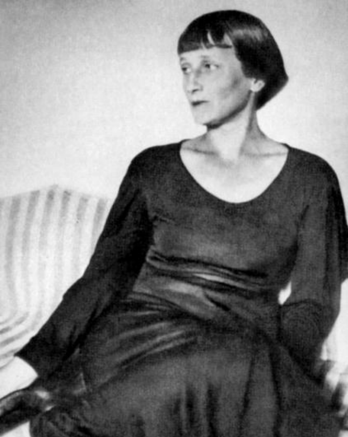
Анна Ахматова. Лето 1936 г.