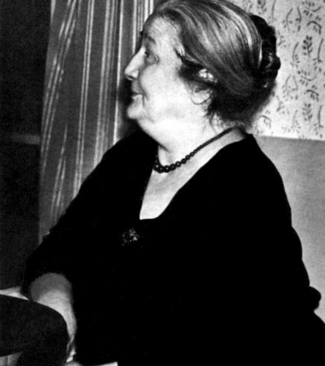
Анна Ахматова. Комарово. Январь 1962 г.