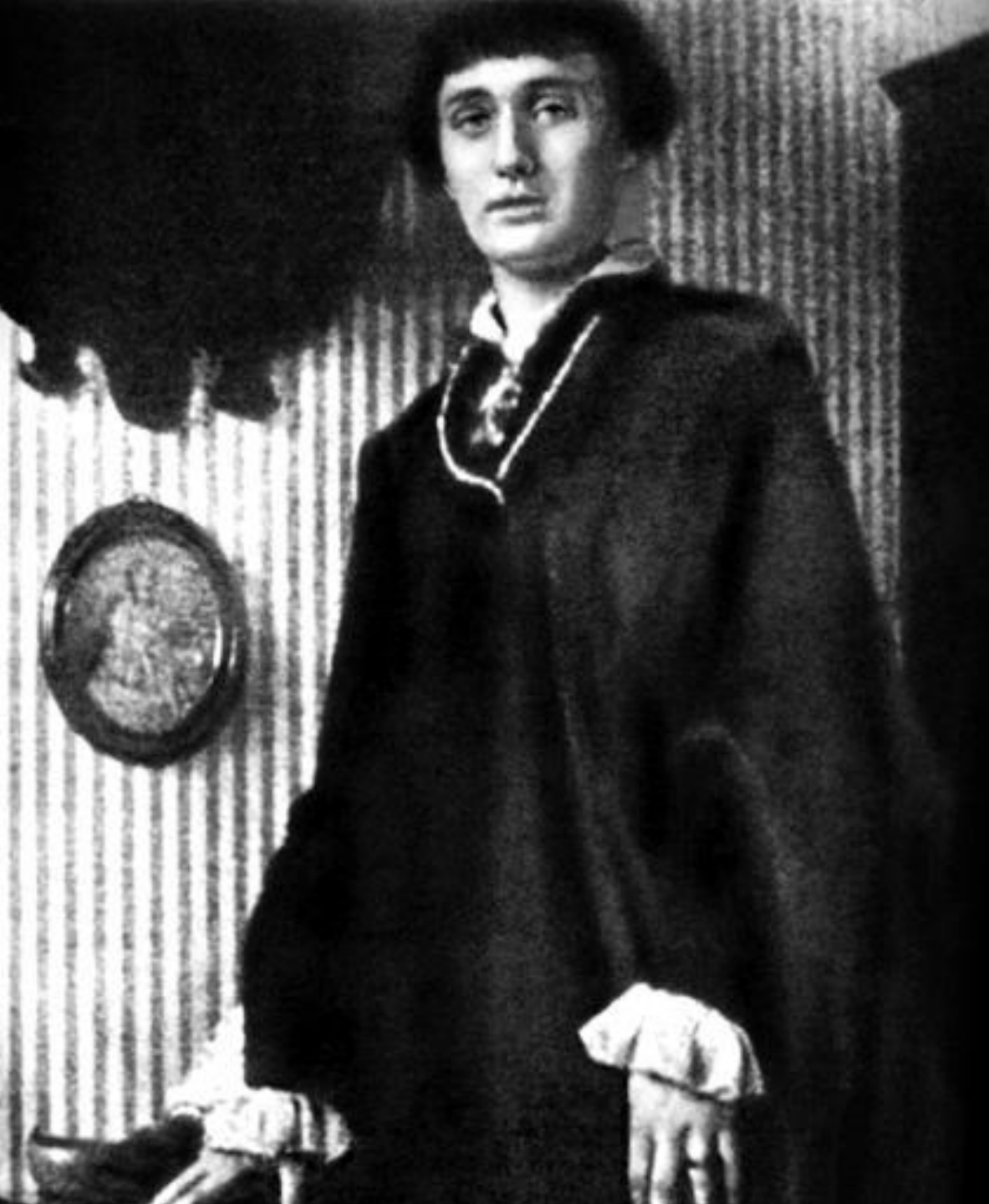
Анна Ахматова. 1910- е годы.