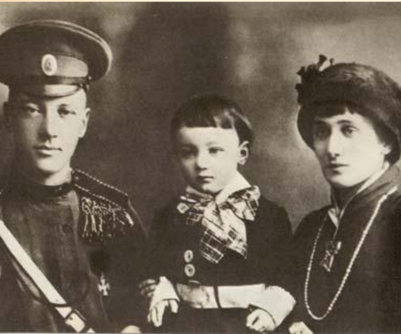
Николай Гумилев и Анна Ахматова с сыном Левой. 1915 год