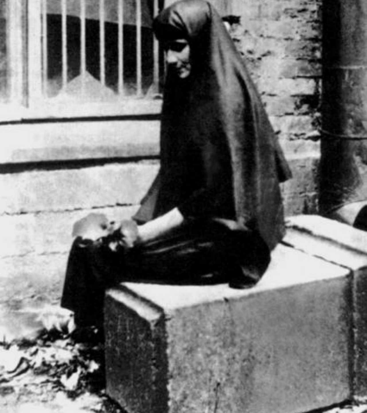
Анна Ахматова. Конец 20-х годов.