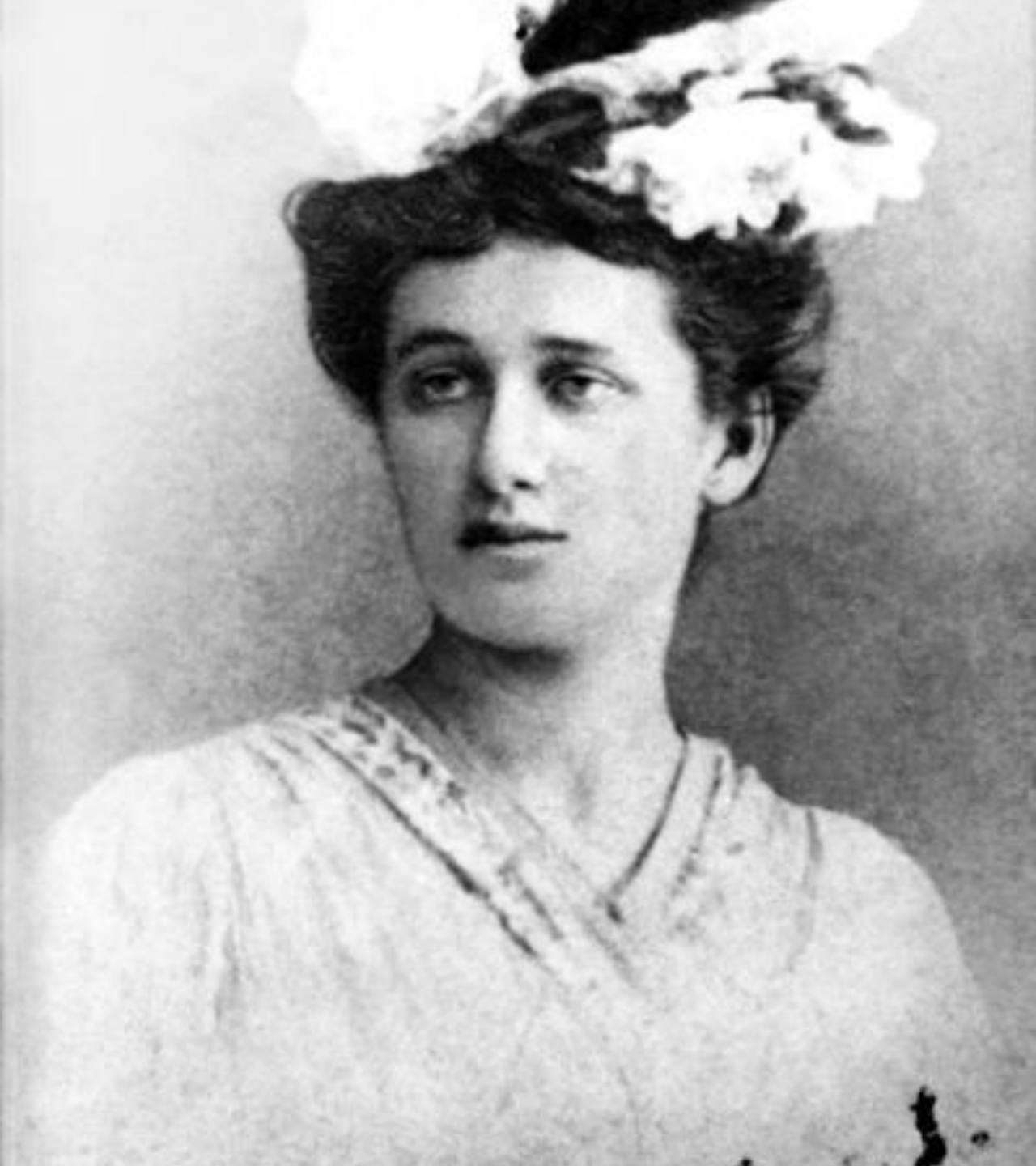
Анна Ахматова. 10-ые годы.