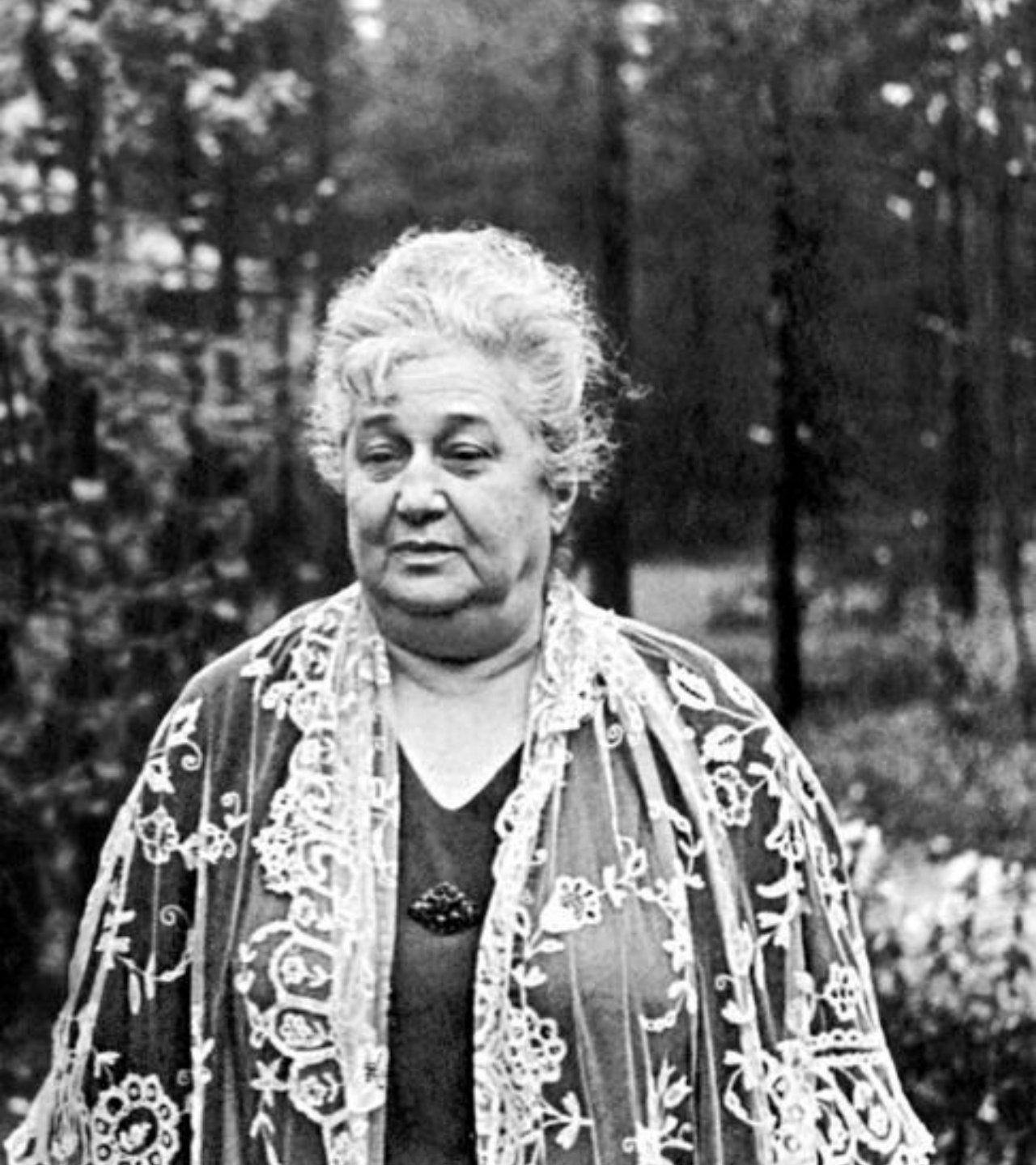
Анна Ахматова. Комарово. Октябрь 1964 г.