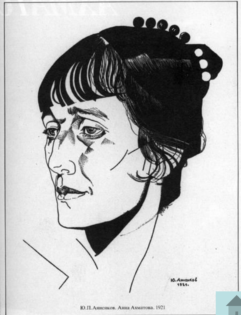
Ю.П.Анненков, Анна Ахматова, 1921

Будь же проклят. Ни стоном, ни взглядом Окаянной души не коснусь, Но клянусь тебе ангельским садом, Чудотворной иконой клянусь, И ночей наших пламенным чадом - Я к тебе никогда не вернусь.