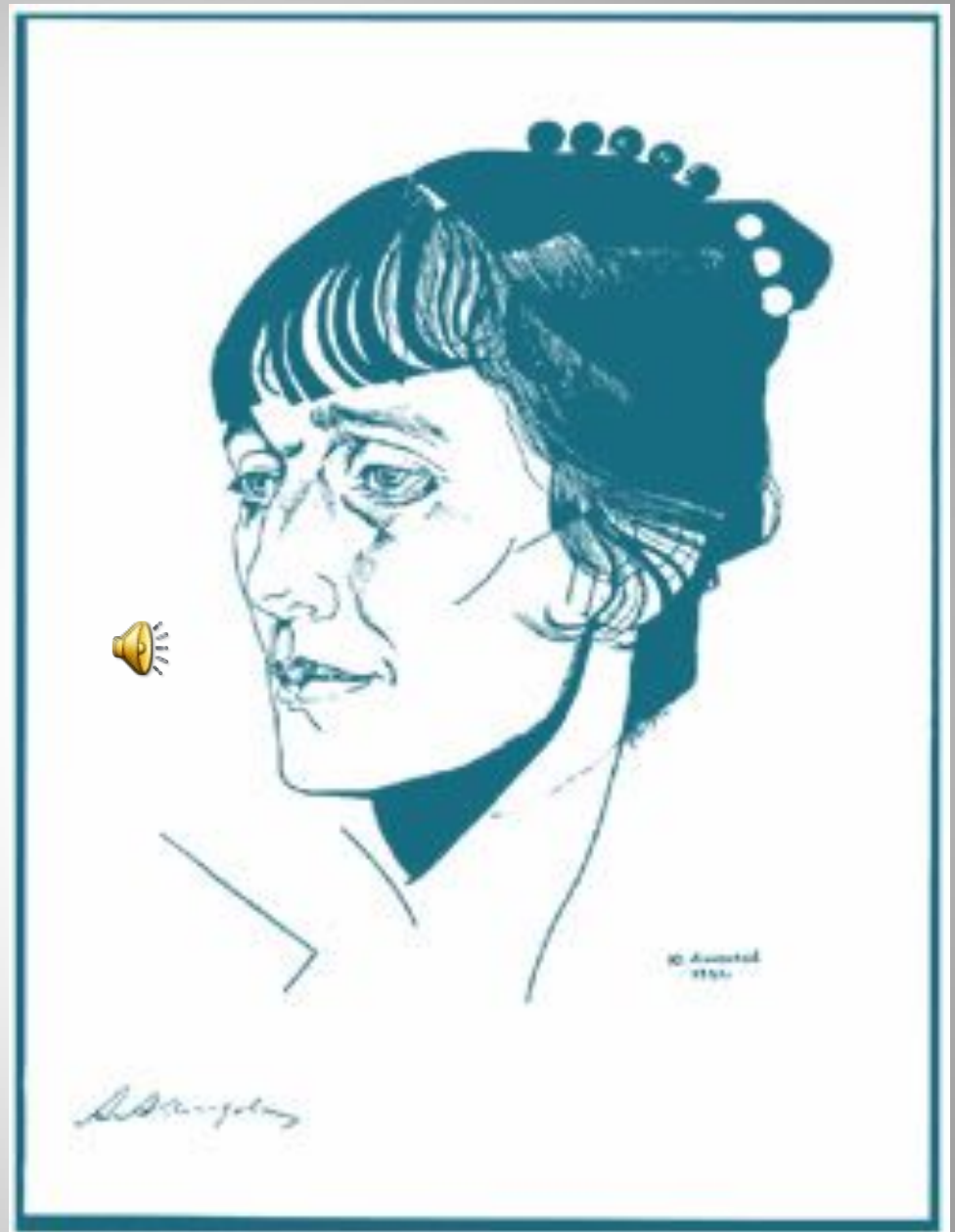
Анна Андреевна Ахматова (Горенко) 1889 -1966