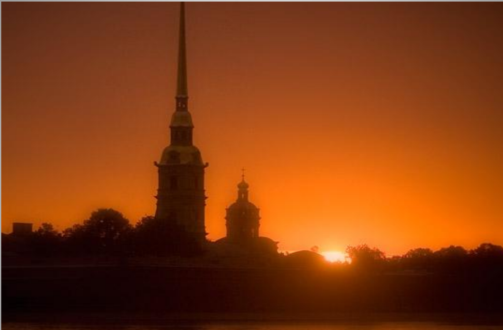
Петербург, Петропавловская крепость