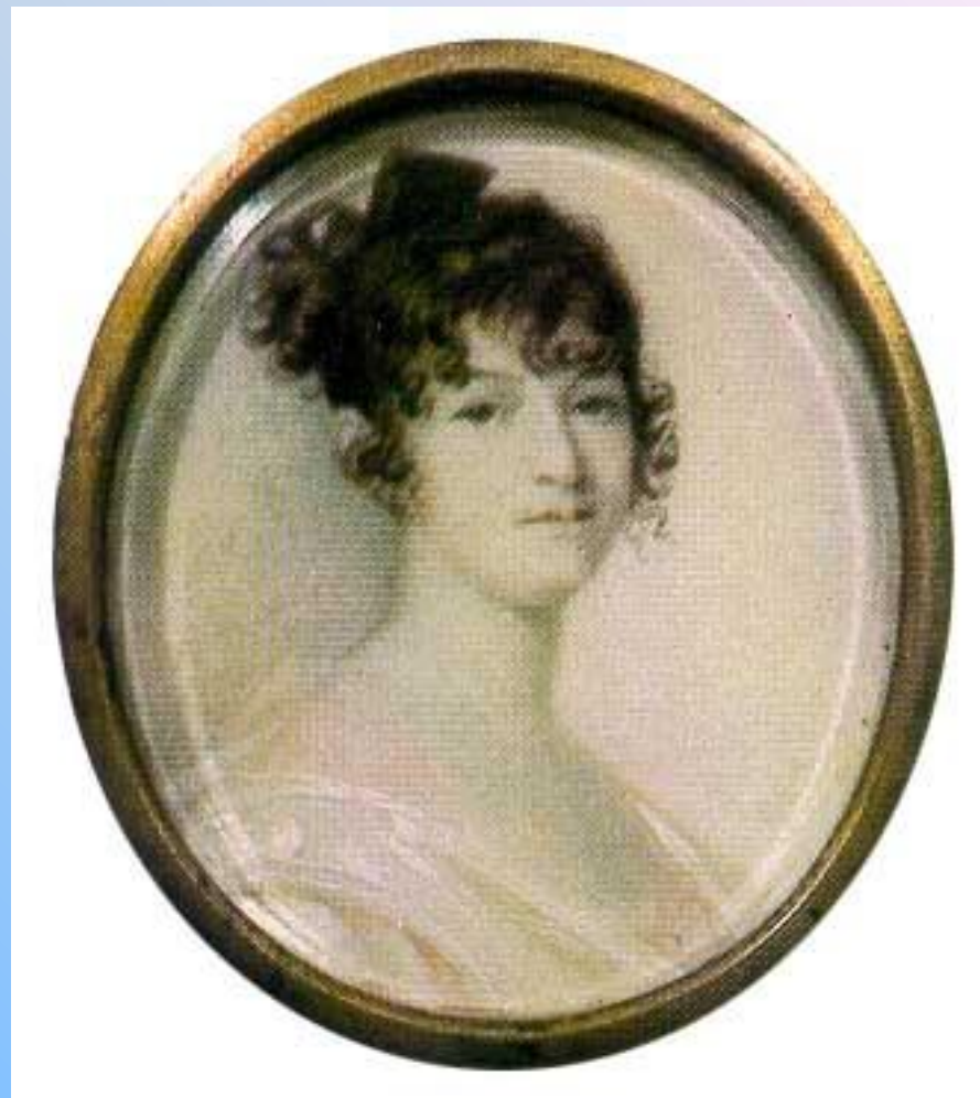
Миниатюра Ксавье де Местра. Н.О. Пушкина. 1800-е гг.