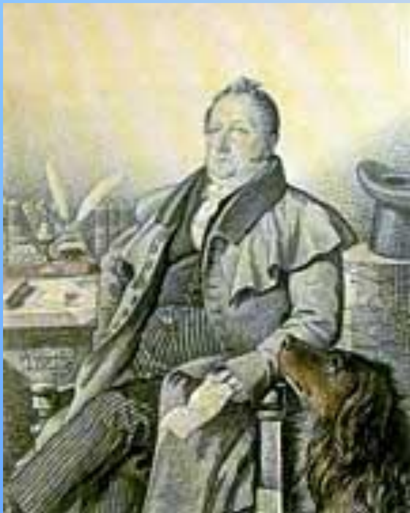
Г.Кампельон С.Л. Пушкин. 1824.