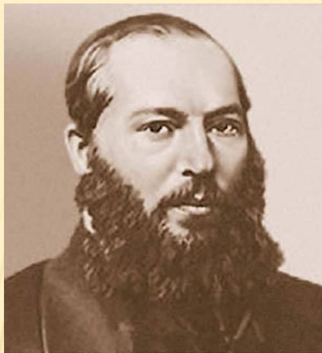
Афанасий Афанасьевич Фет