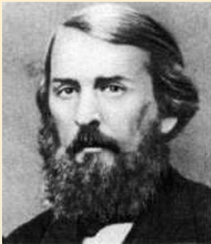
Алексей Николаевич Плещеев