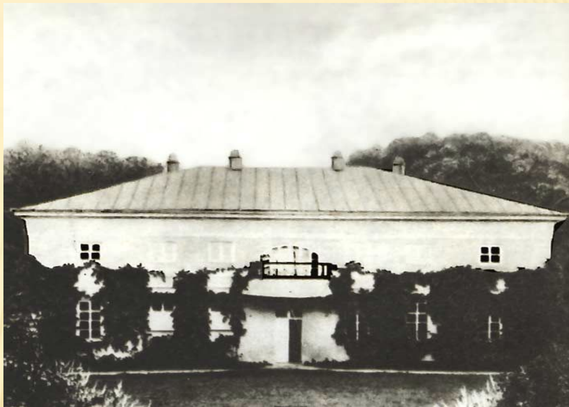
Дом, где провёл детство А.А.Фет