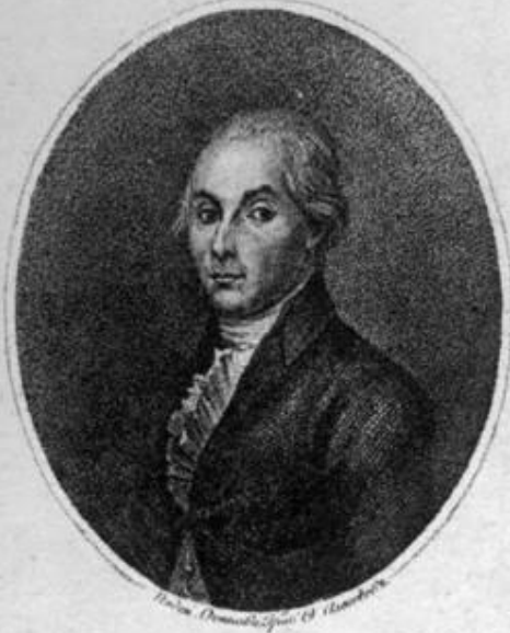
А. Н. Радищевъ