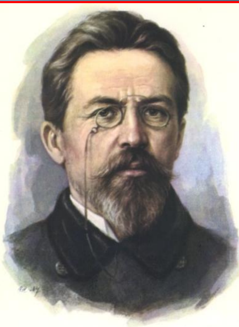
АНТОН ПАВЛОВИЧ ЧЕХОВ (1860—1904)