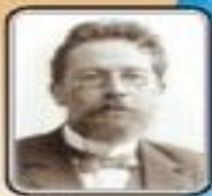
АВТОР: А. П. Чехов