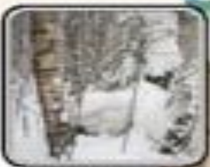
ИЛЛУСТРАЦИЯ: Павел Иванович Давыдов