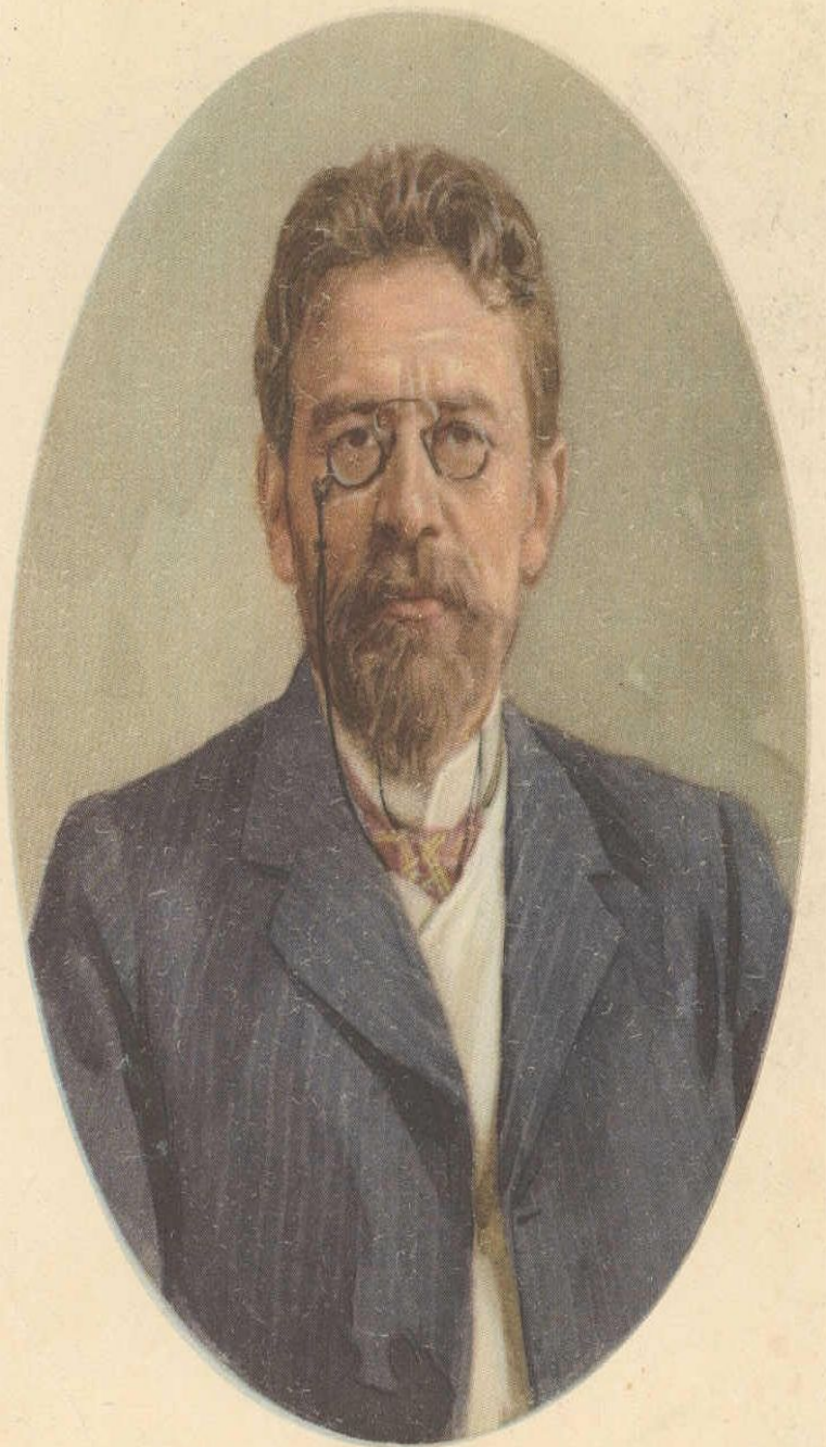
Антон Павлович Чехов