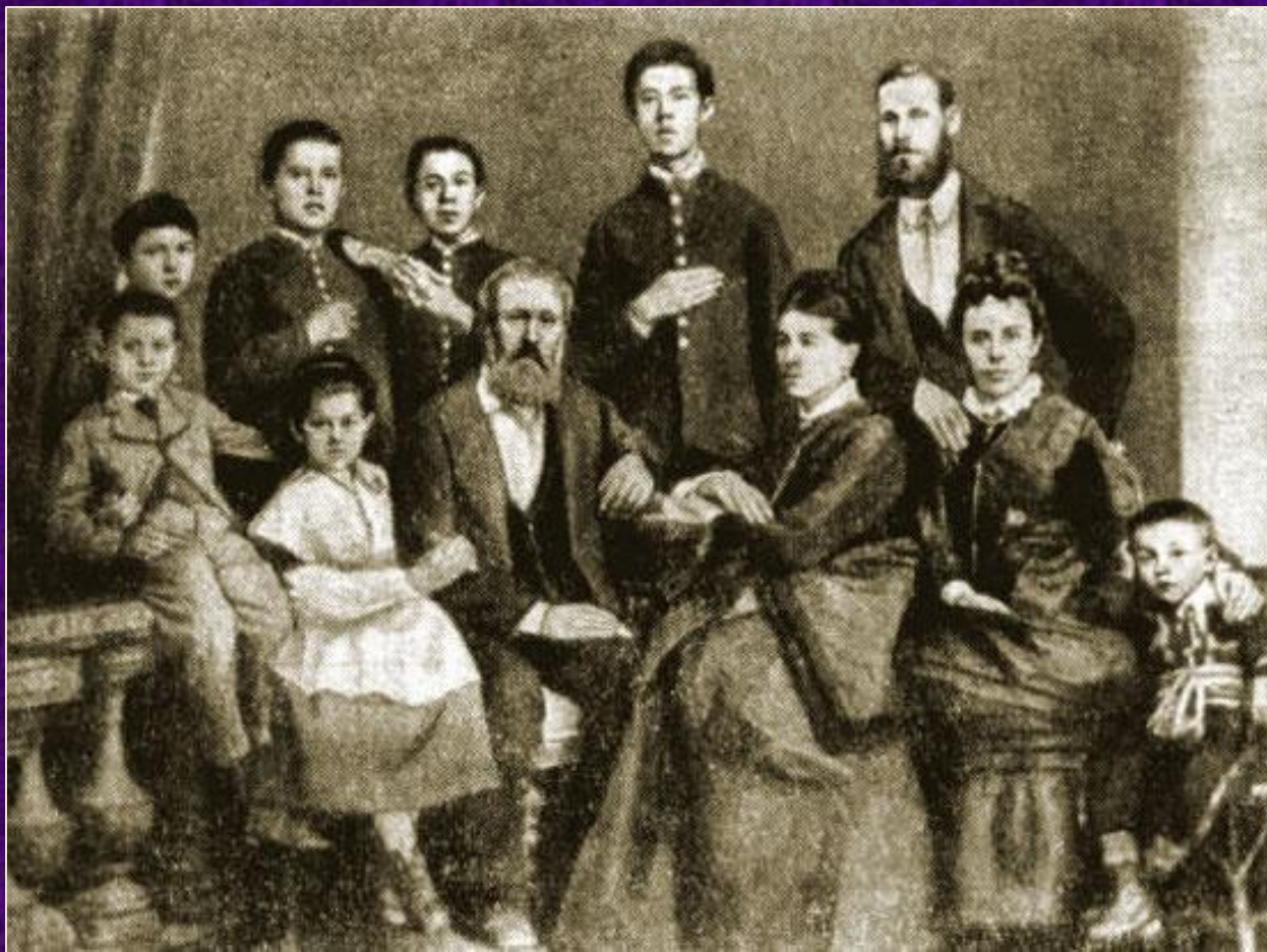
Семья Чехова. 1874 год

«Талант в нас со стороны отца, а душа со стороны матери»