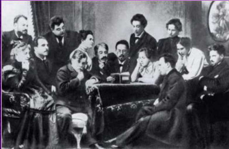
Чехов среди актеров МХТа