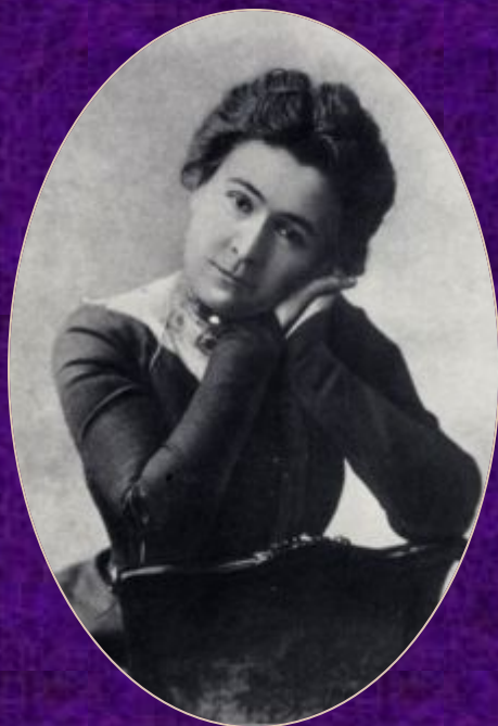
Ольга Леонардовна Книппер