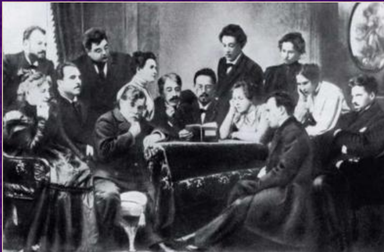
Чехов среди актеров МХТа