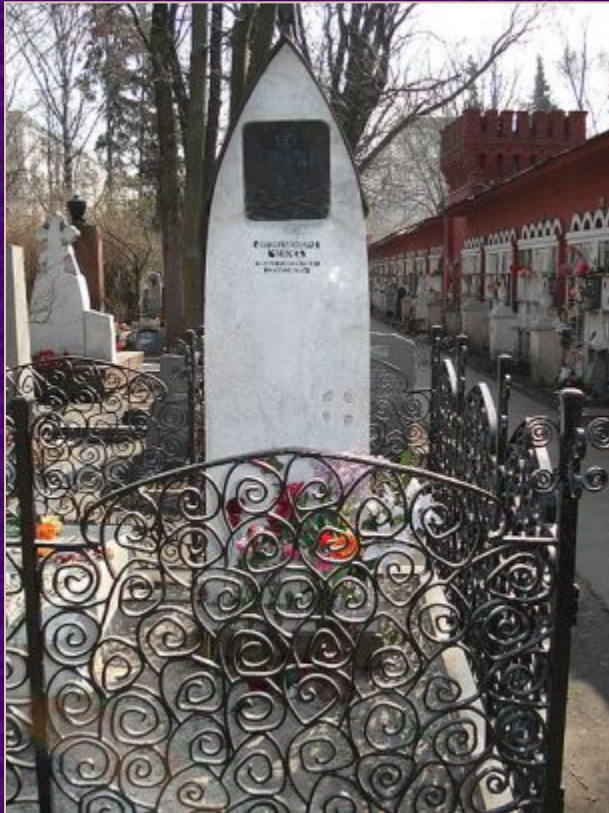
Могила Чехова на Новодевичьем кладбище в Москве