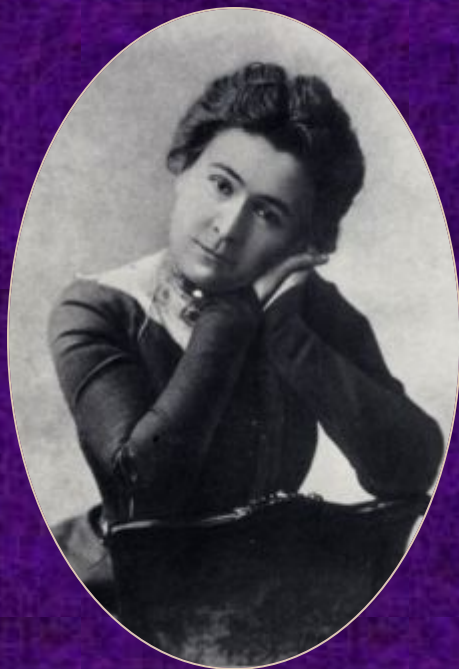
Ольга Леонардовна Книппер