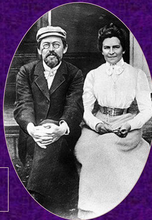
А.П. Чехов и О.Л. Книппер 03.12. 1901

женился на ведущей актрисе Московского Художественного театра О.Л. Книппер.