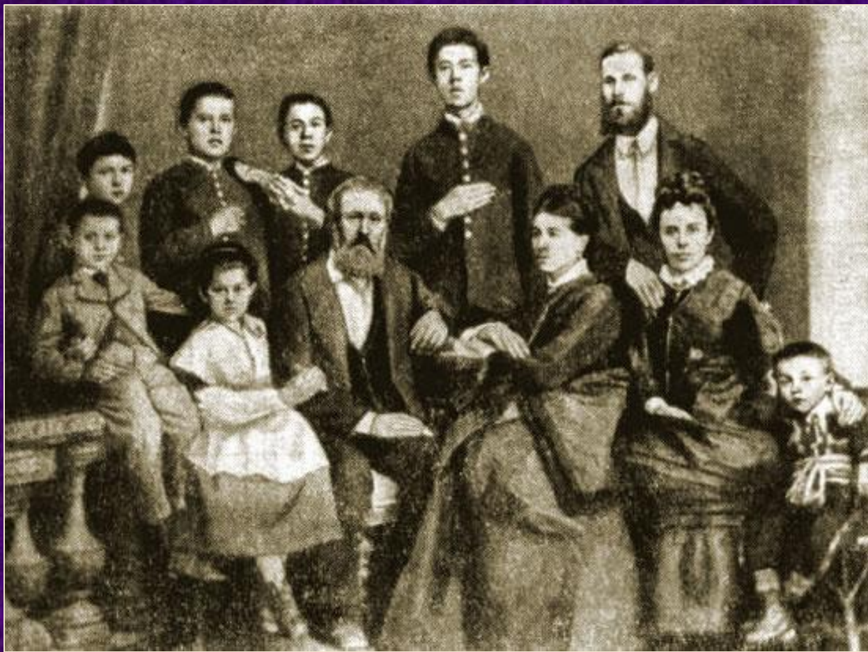
Семья Чехова. 1874 год

«Талант в нас со стороны отца, а душа со стороны матери»