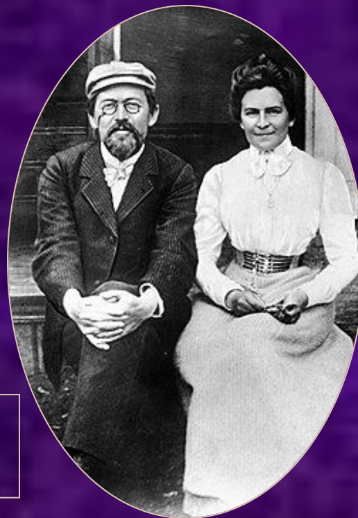
А.П. Чехов и О.Л. Книппер 03.12. 1901

женился на ведущей актрисе Московского Художественного театра О.Л. Книппер.