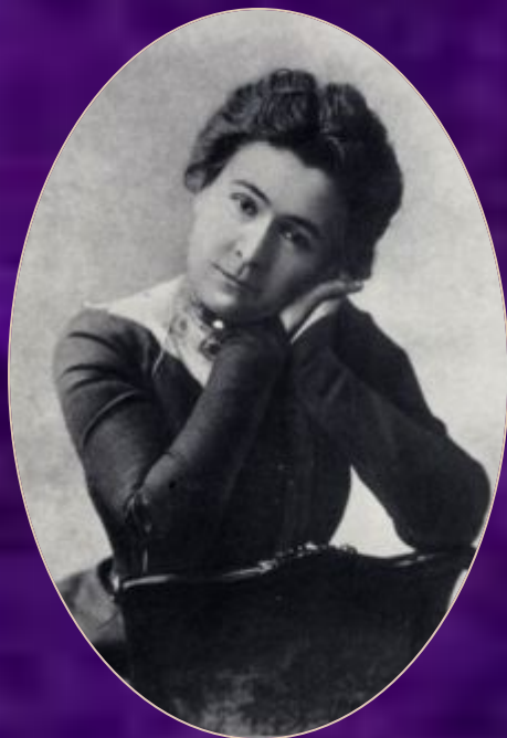
Ольга Леонардовна Книппер