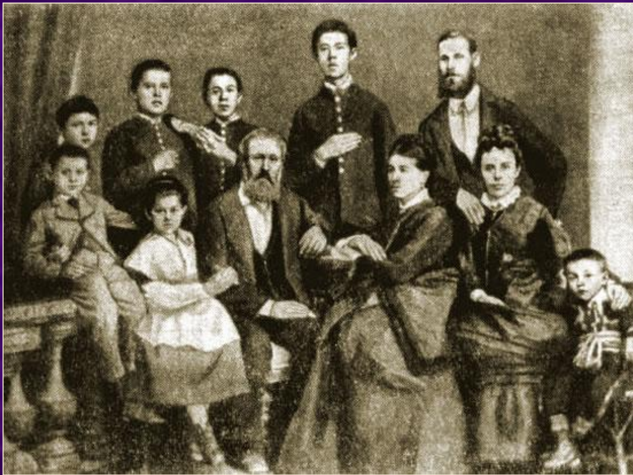
Семья Чехова. 1874 год

«Талант в нас со стороны отца, а душа со стороны матери»