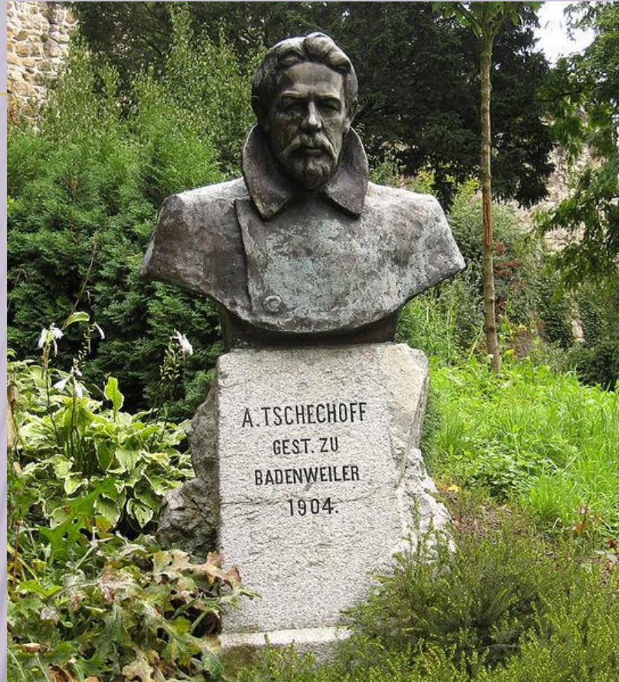
памятник Чехову в Баденвейлере