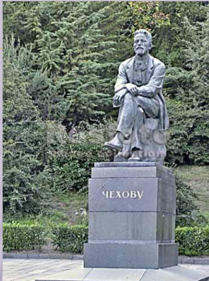
памятник А.П. Чехову в Крыму (Украина)