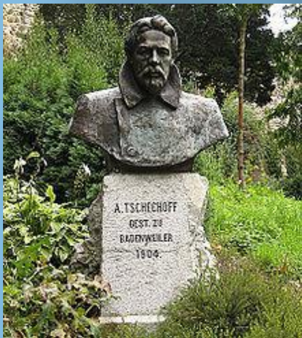
Памятник Чехову в Баденвайлере