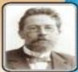
АНТОН А. П. ЧЕХОВ