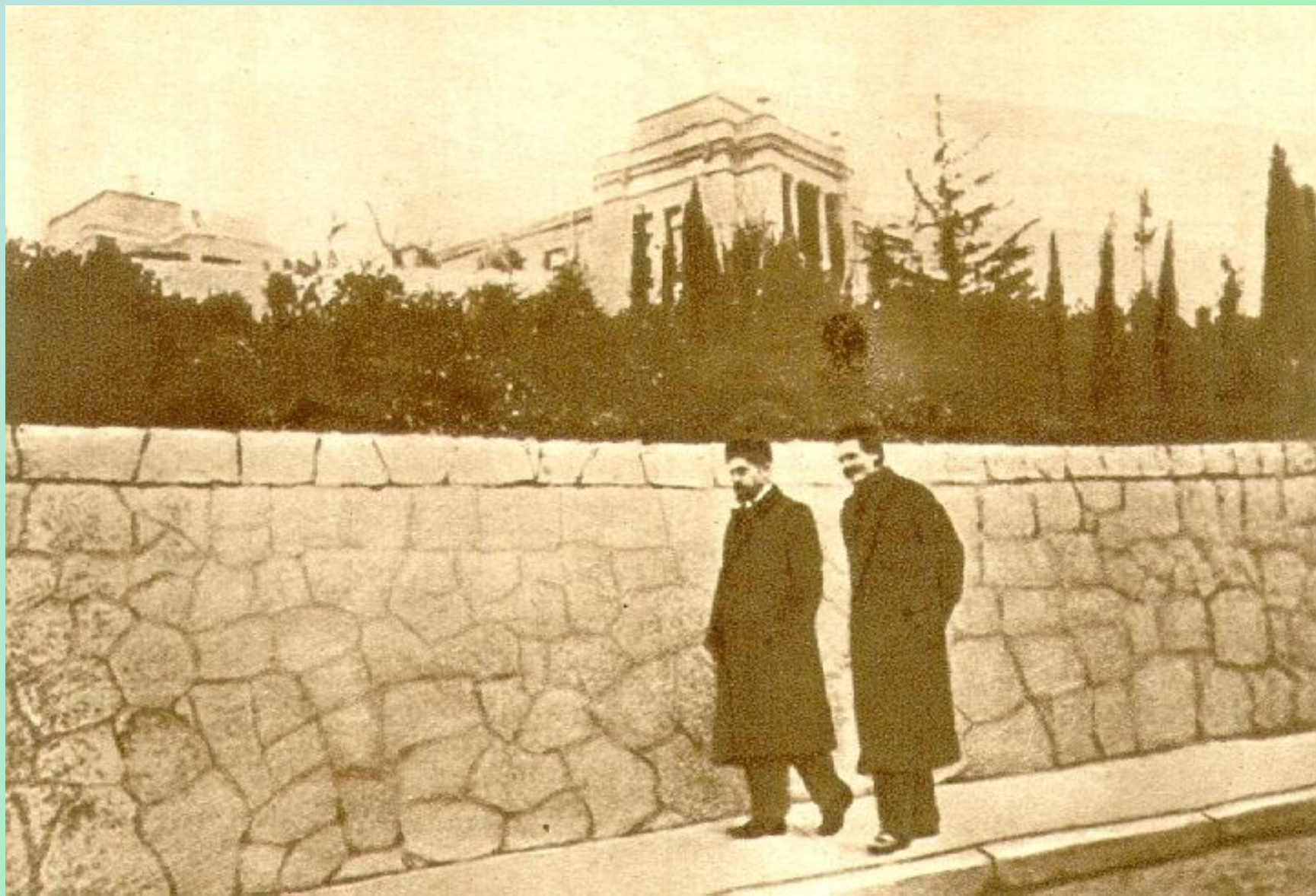
Чехов и М.Горький в Ялте