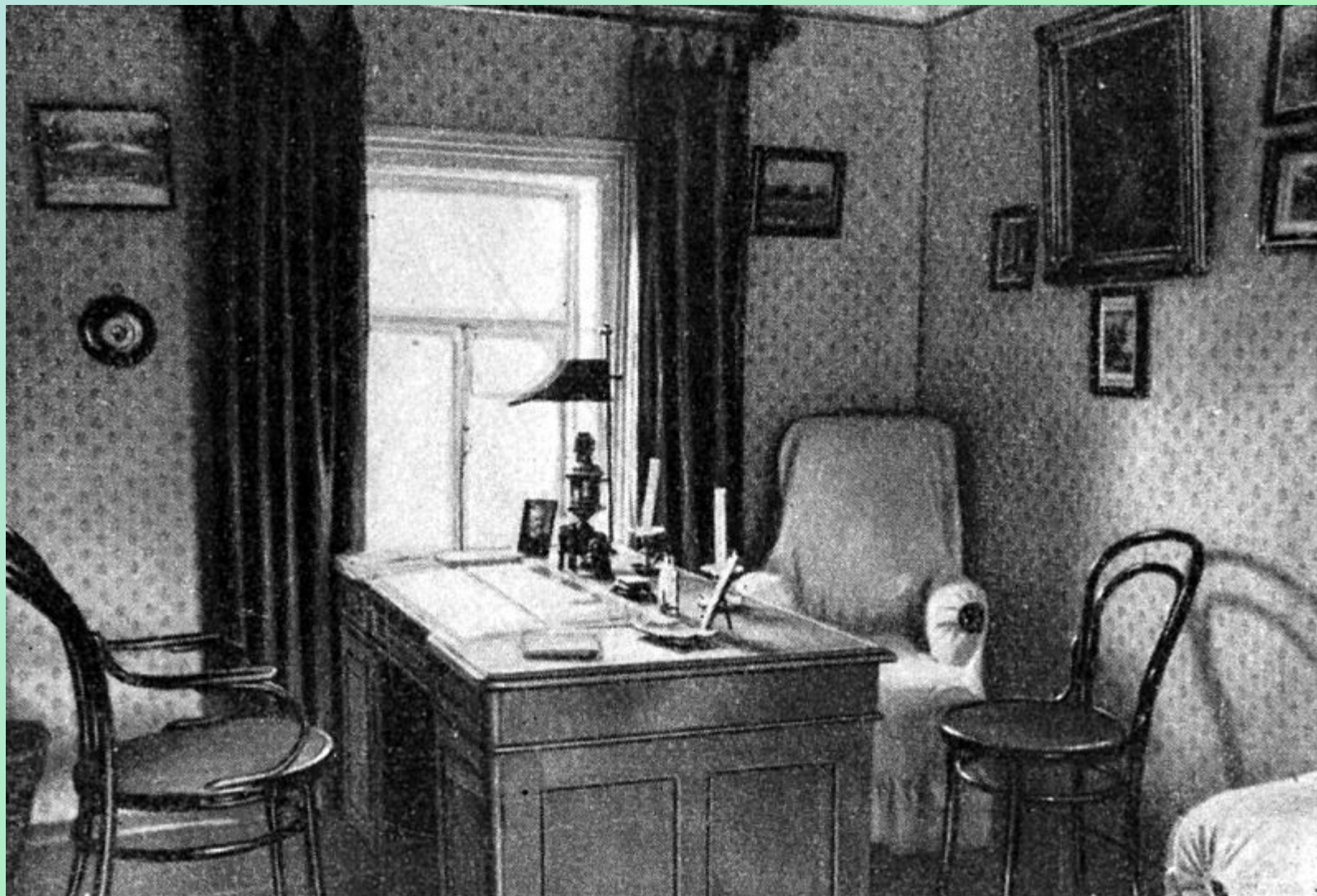
Рабочий кабинет во флигеле