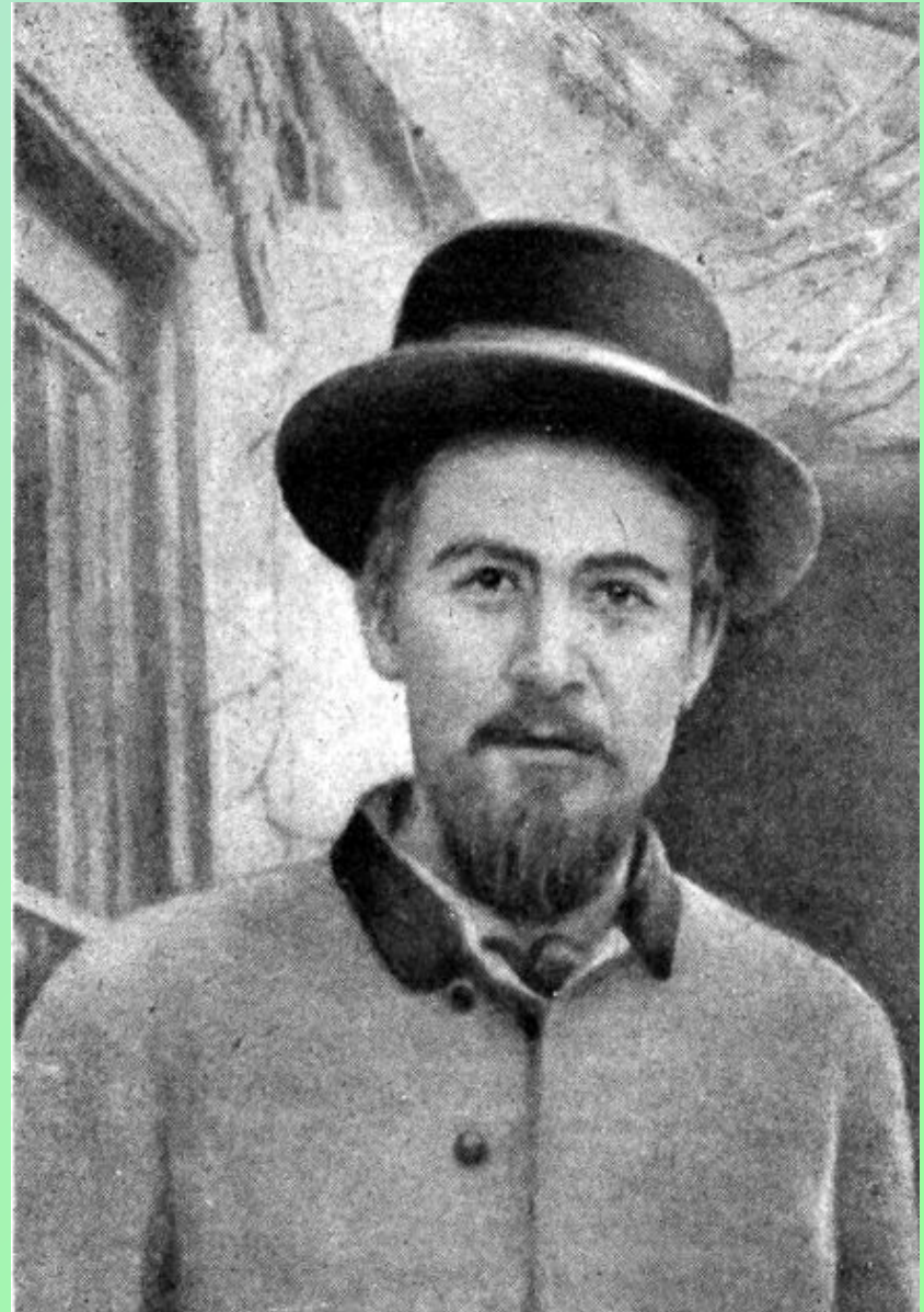
На Садово- Кудринской

«Милая Чехия» – дом на Садово – Кудринской улице в Москве. Здесь прошли самые счастливые годы поэта; здесь Чехов ежедневно принимал больных.