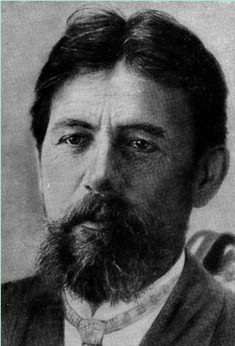
Последняя фотография Чехова

1904г. май– по совету врачей вместе с женой выехал на курорт в Баденвейлере (юг Германии).