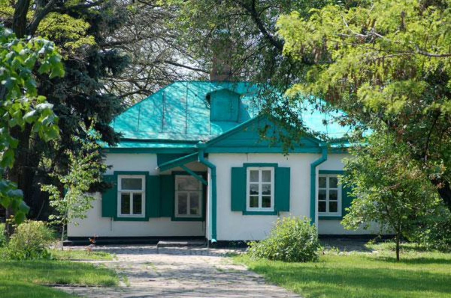
Дом Чеховых в Таганроге