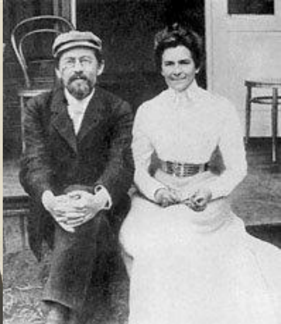
А. П. Чехов и О. Л. Книппер