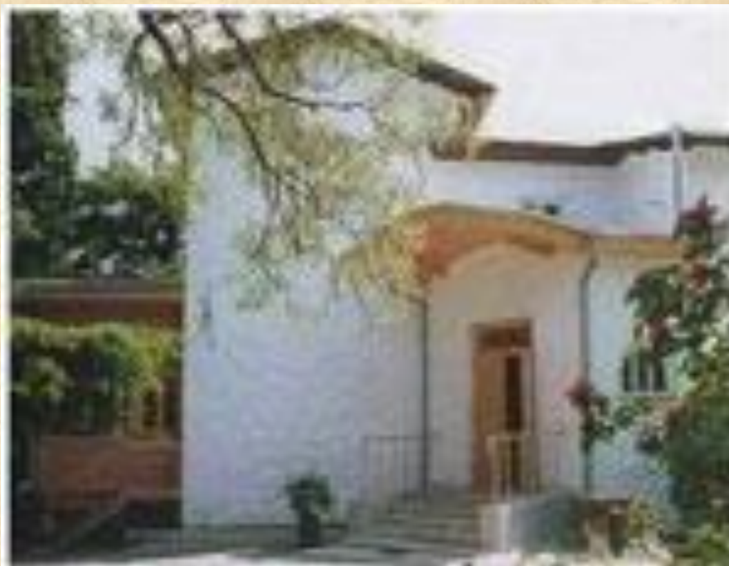
Дом писателя в Ялте