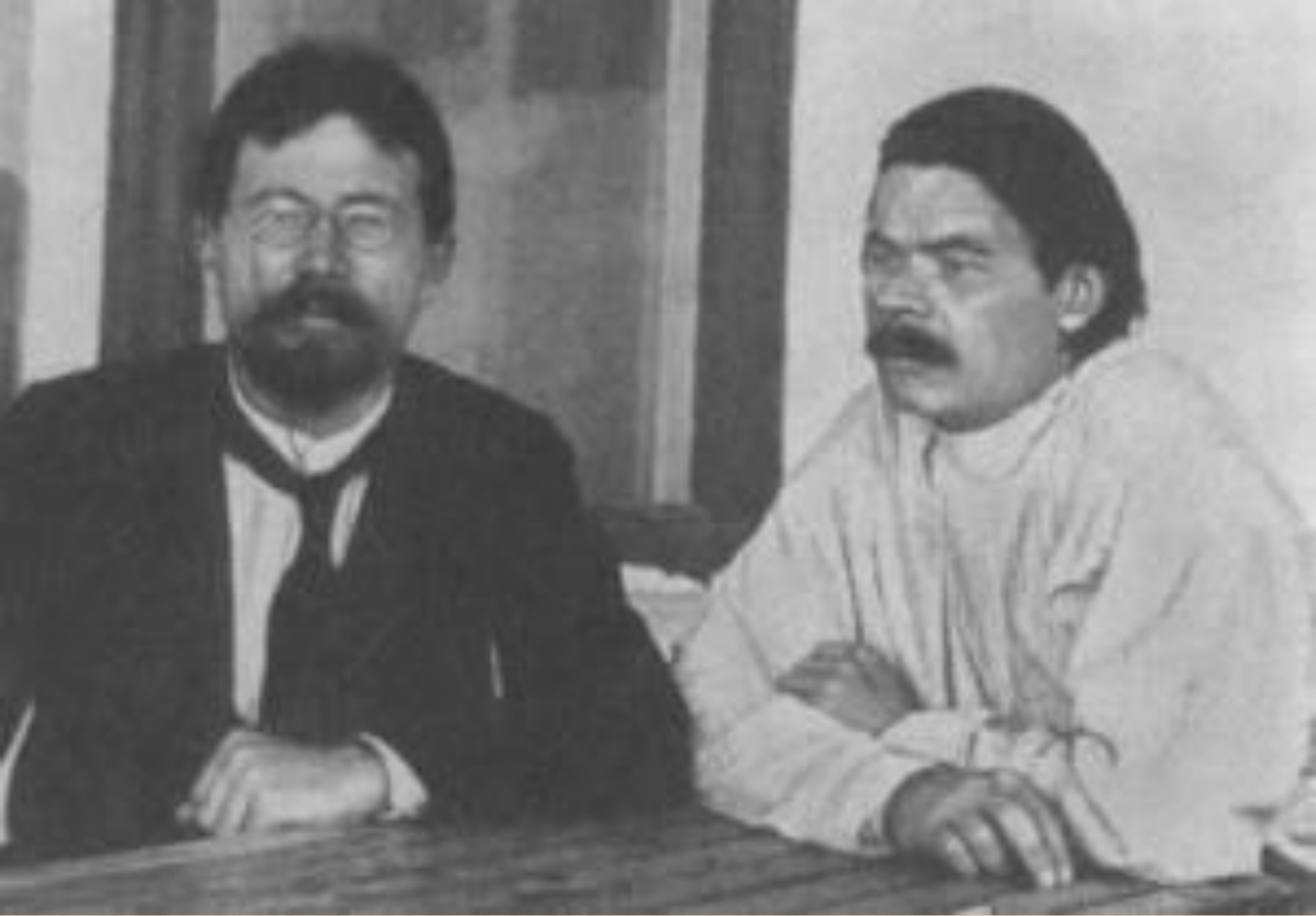
А. Чехов и М. Горький