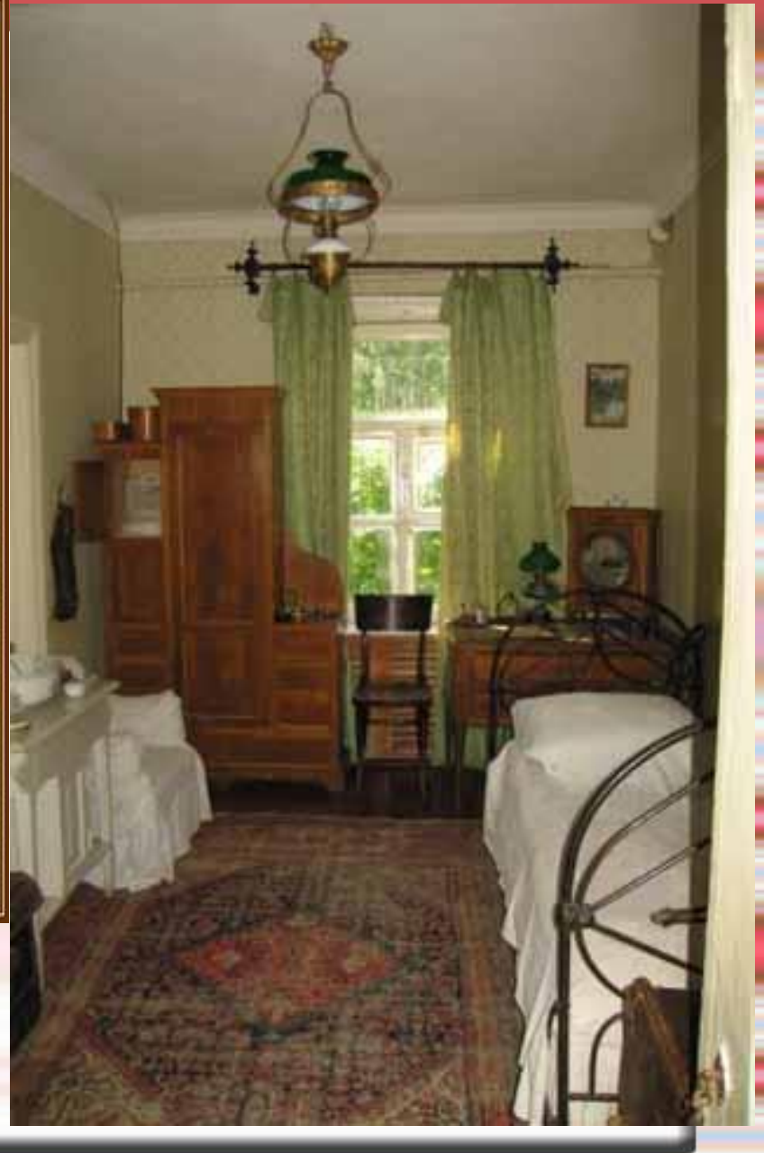
МУЗЕЙ ЧЕХОВА В МЕЛИХОВЕ