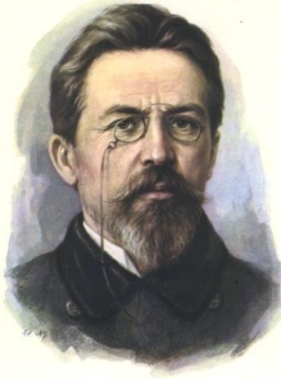
Антон Павлович Чехов (1860—1904)