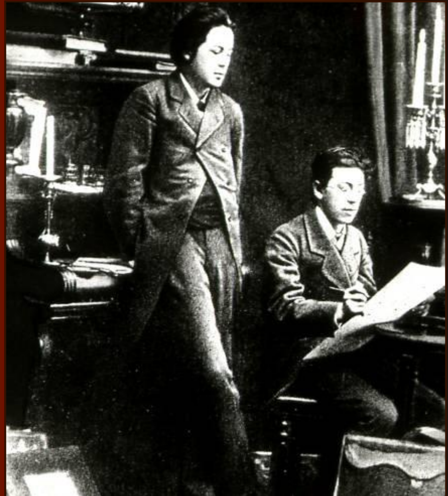
А.П. Чехов с братом Николаем