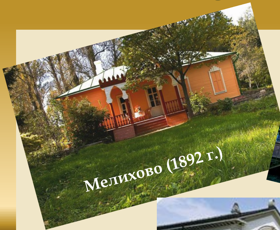
Мелихово (1892 г.)