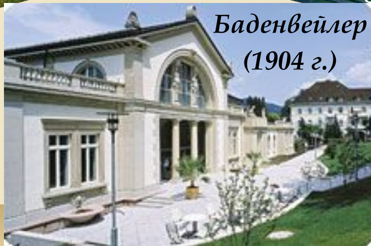
Баденвейлер (1904 г.)