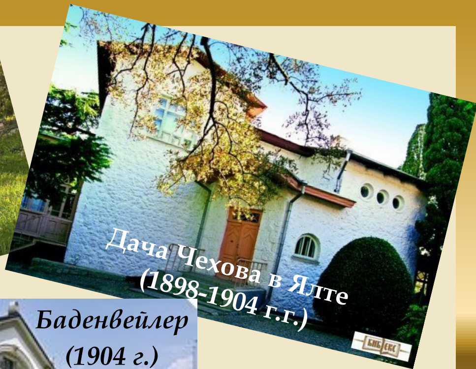
Дача Чехова в Ялте (1898-1904 г.г.)