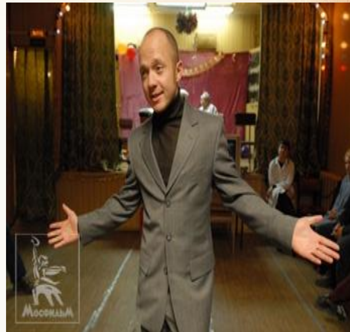
Евгений Стычкин в роли Хоботова.