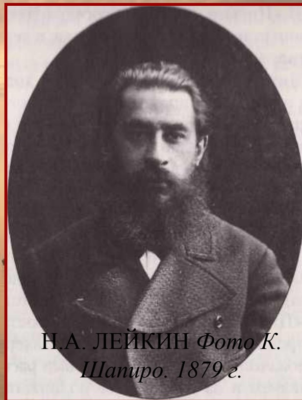
Н.А. ЛЕЙКИН 1879 г.

В 1882 г. Чехов получает приглашение сотрудничать в один из самых популярных юмористических журналов – «Осколки», издаваемый писателем Николаем Александровичем Лейкиным