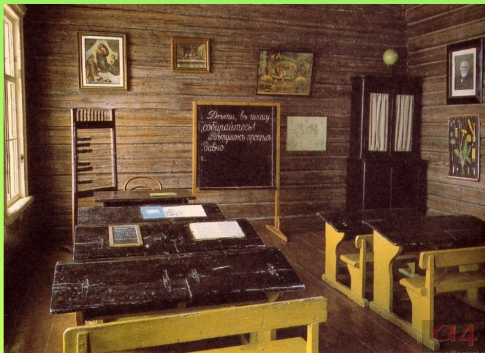
Класс мелиховской школы

В Мелихове и его окрестностях Чехов строит три школы для крестьянских детей.