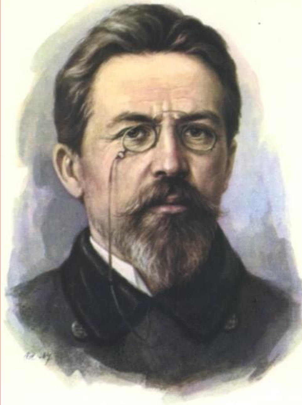
АНТОН ПАВЛОВИЧ ЧЕХОВ (1860—1904)