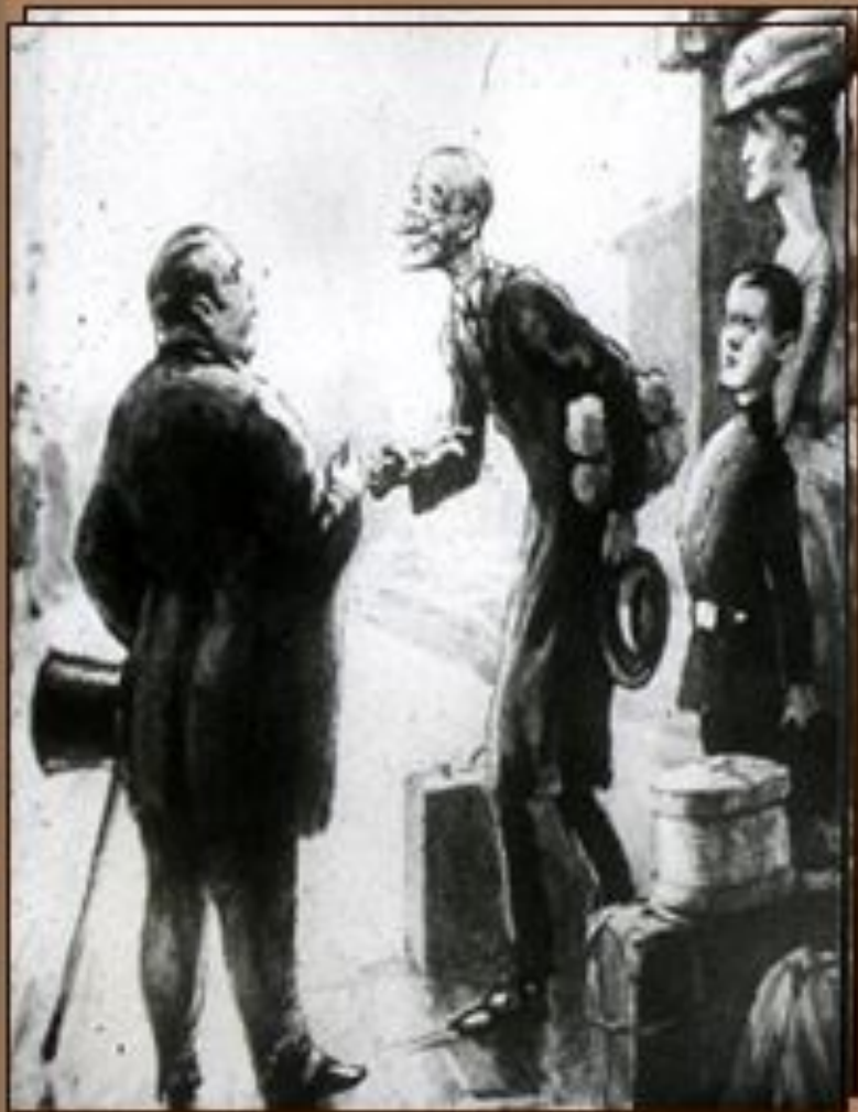
«Толстый и тонкий».