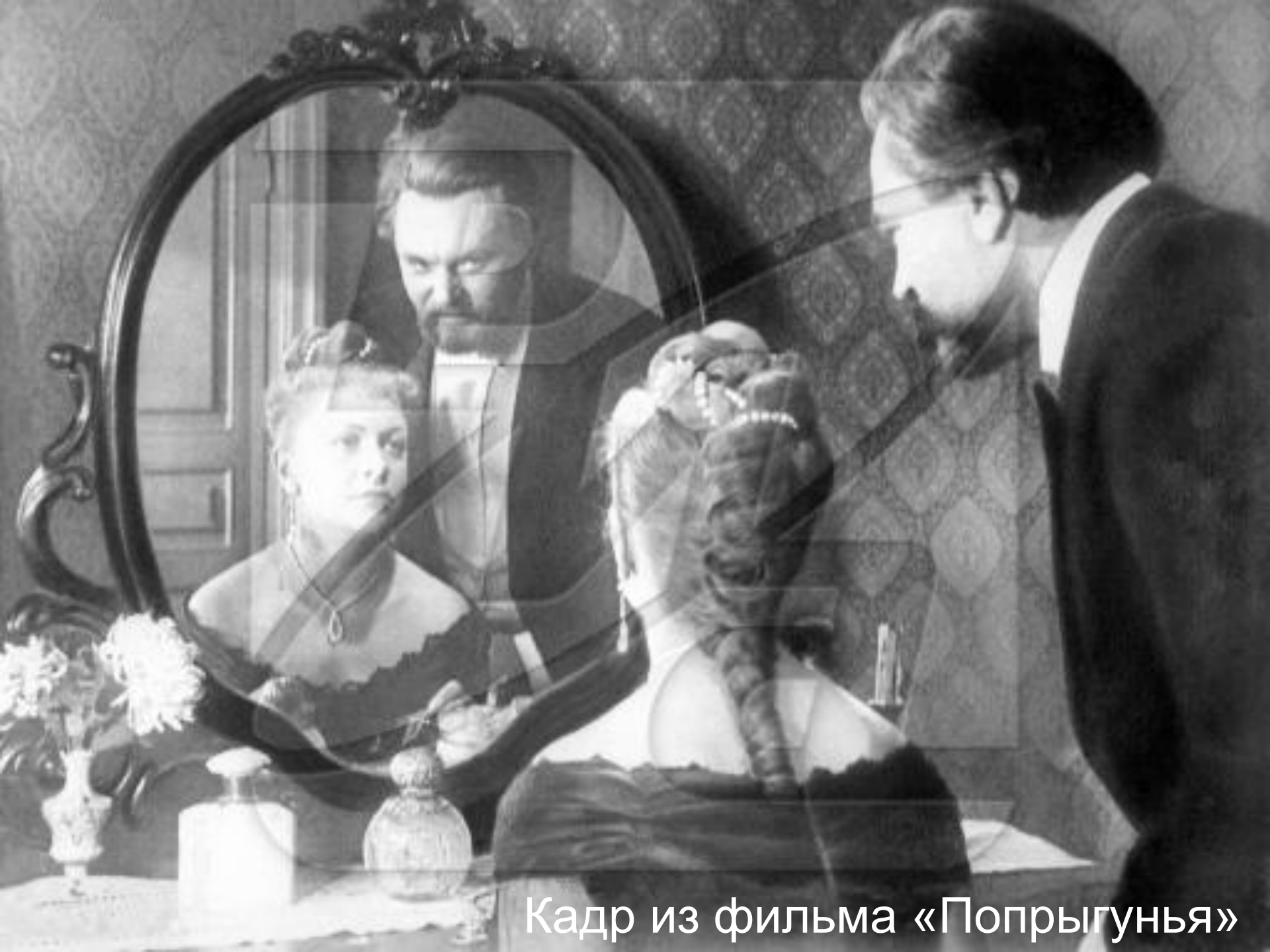
Кадр из фильма «Попрыгунья»