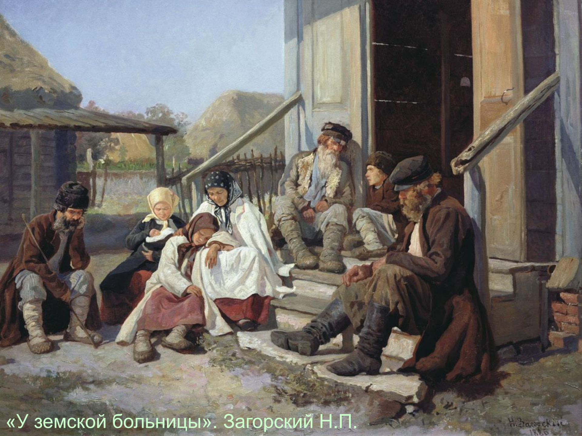
«У земской больницы». Загорский Н.П.