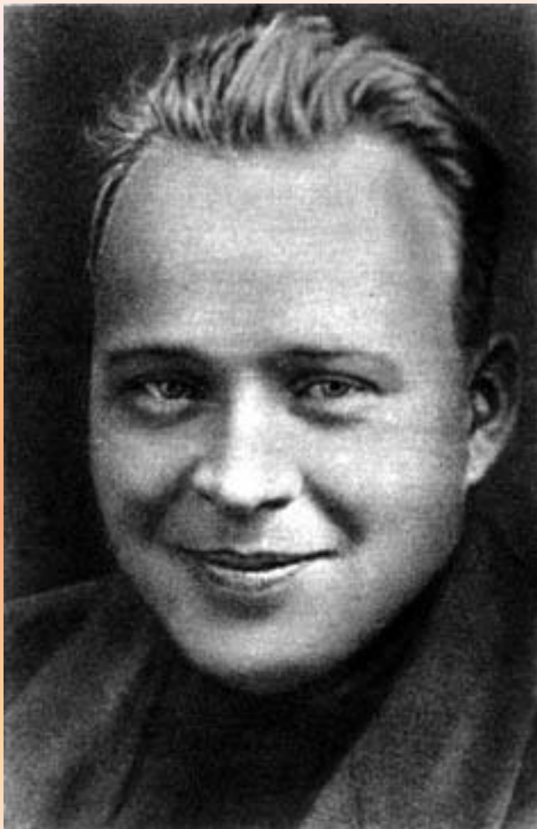
Аркадий Петрович Гайдар (1904- 1941)