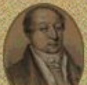
Василий Львович Пушкин 1766 - 1830