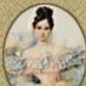
Наталья Николаевна Гончарова 1812 - 1863