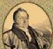
Сергей Львович Пушкин 1770 - 1848