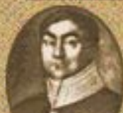
Петр Абрамович Ганнибал 1742 - 1825