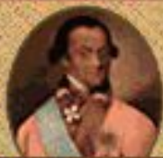
Абрам Петрович Ганнибал 1696 - 1781