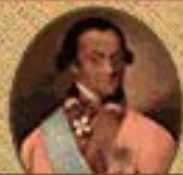
Абрам Петрович Ганнибал 1696 - 1781