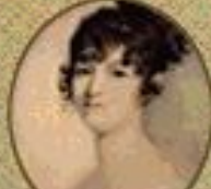
Надежда Осиповна Ганнибал 1775 - 1836