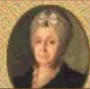
Сарра Юрьевна Ржевская ок.1721-не ранее 1790