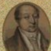
Василий Львович Пушкин 1766 - 1830