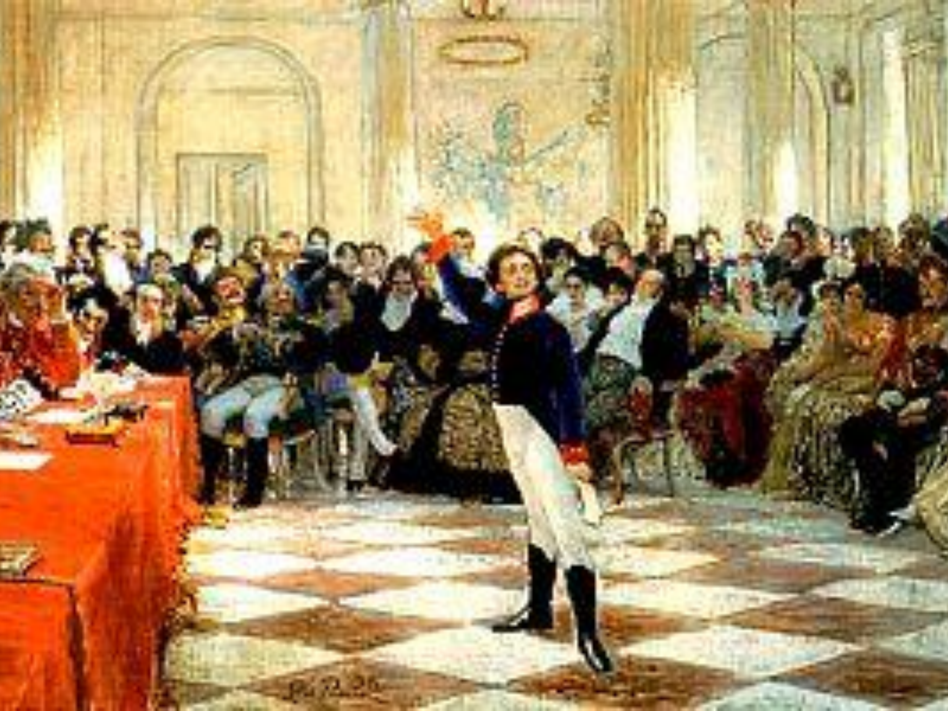
Fig. 2. 26