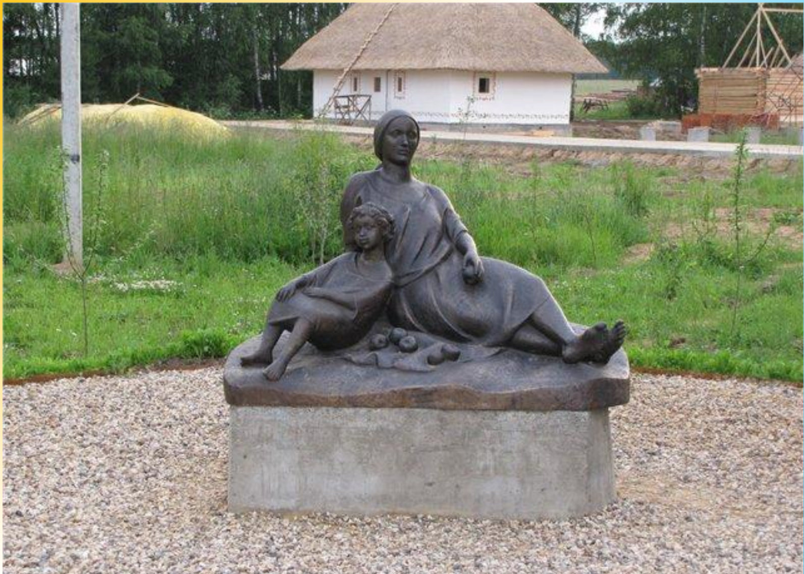
Калуга. Няня изображена молодой женщиной