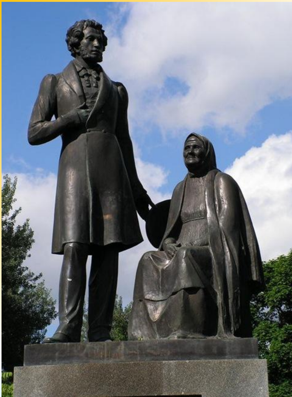
Памятник А.С. Пушкину и Арине Родионовне в городе Пскове