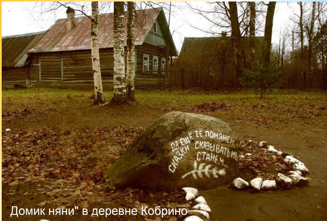
"Домик няни" в деревне Кобринно

Эта удивительная женщина оставила глубокий след в жизни и творчестве поэта. Неслучайно любимой няне Пушкин посвятил несколько стихотворений. В одном из них он писал: "Да еще ее помянем: Сказки сказывать мы станем — Мастерица ведь была И откуда что брала..."