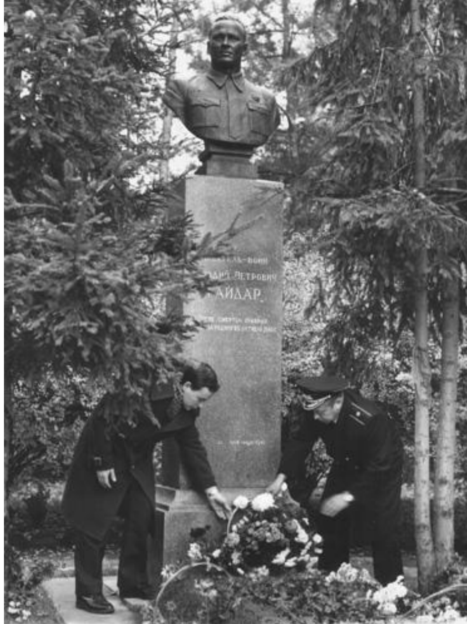
Аркадий Гайдар погиб в самом начале Великой Отечественной войны в бою около деревни Леплява Каневского района Черкасской области 26 октября 1941 г.