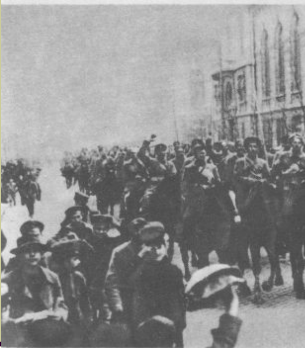
На улицах города.