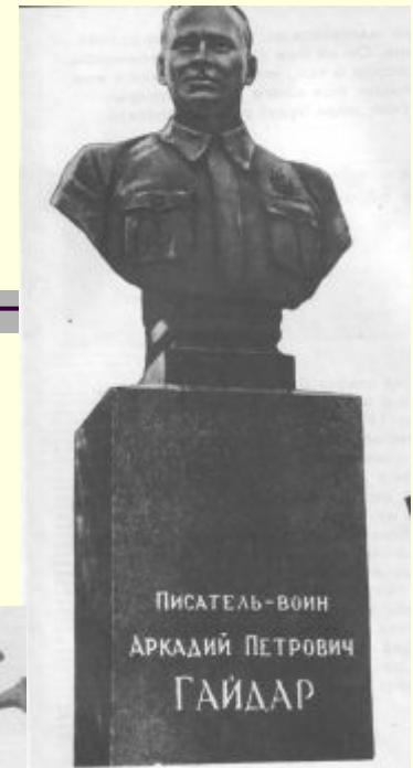
В городе Каневе на могиле писателя.