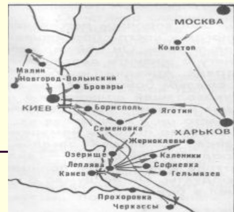
Карта боевых дорог А.Гайдара.

«Не хочу быть в запасе», - писал 22 июня 1941 года Аркадий Гайдар в заявлении отправить его на фронт.