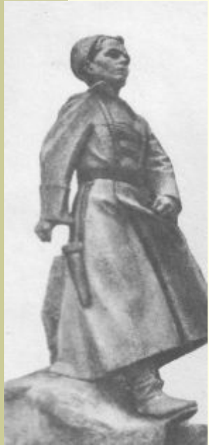
В городе Арзамасе.