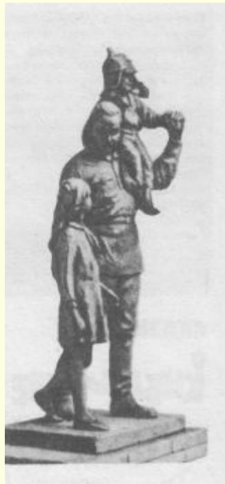
Скульптурная группа «Гайдар с детьми»