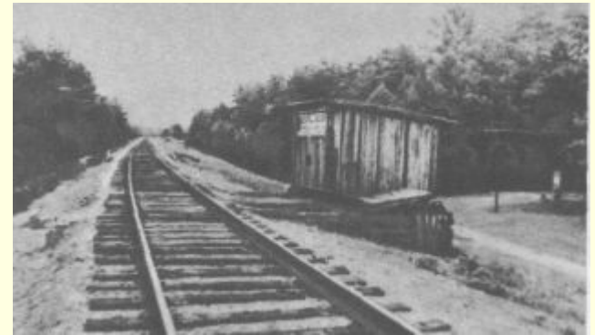
Место гибели А.Гайдара.