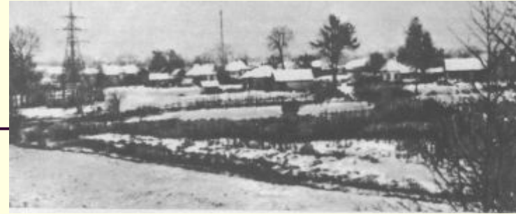
Село Леплява Каневского района под Киевом, возле которого погиб А.Гайдар.

■ А.Гайдар, защищавший Родину, погиб, чтобы ценой своей жизни спасти товарищей.