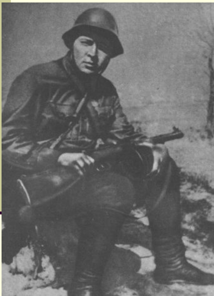
А.Гайдар на фронте. 1941 г.