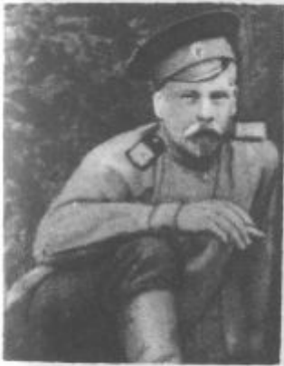
П. И. Голиков в годы империалистической войны.

Милый дорогой папа на лицах моих товарищей я вижу я вижу ответы на вопросы что думают солдаты о войне, правда ли говорят они так, что будут наступать наши только в мае и если снаряды выстрелят на перед ней фронт. ты ловишь буржу азов, а когда и мы обалдеем. Да что эти венеры и не это надо от вас и вас дисциплина какая у вас у солдат и инженеров большевиков и Ленину. Меня ужасно интересуют эти вопросы. как тебе ду об этом говорят