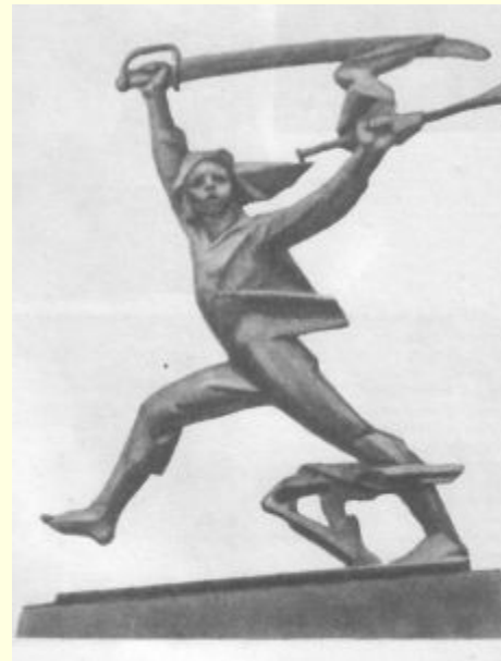
Скульптура Мальчиша-Кибальчиша в Москве на Ленинских горах.