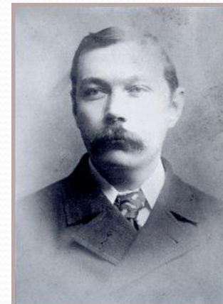
Arthur Conan Doyle as a young doctor