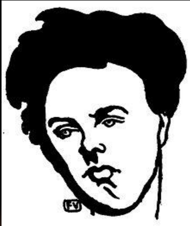
Ф. Валлотон . Портрет Артюра Рембо, ок. 1898