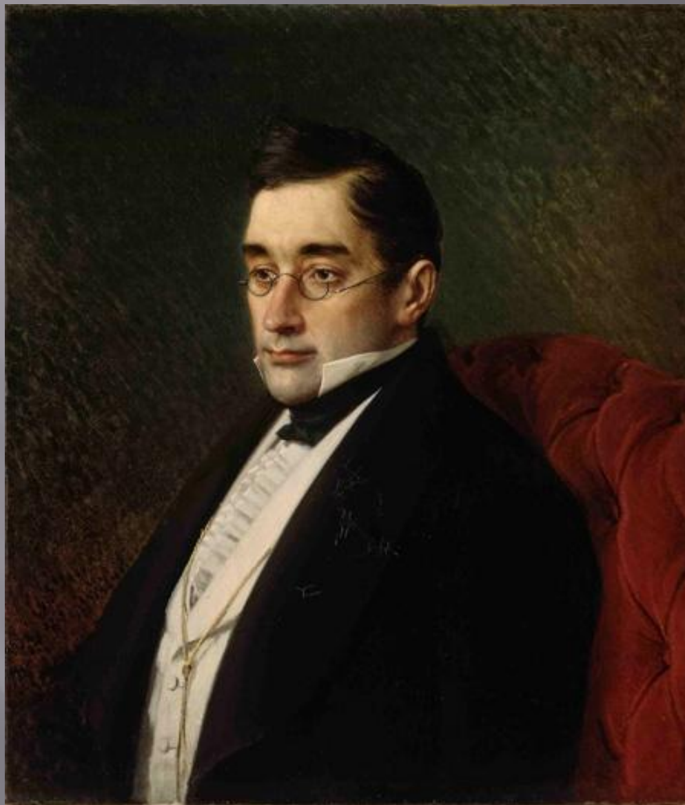
А.С.Грибоедов: жизнь и судьба