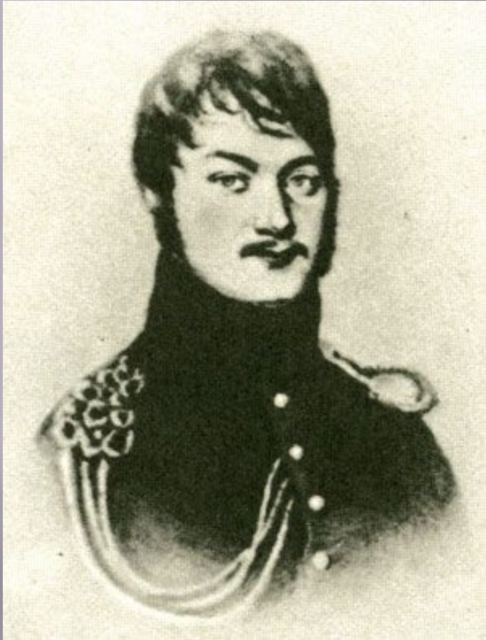
С. Н. Бегичев

“Ты, мой друг, поселил в меня любовь к добру, я с тех пор начал дорожить честностью и всем, что составляет истинную красоту души, ... с тобой я становлюсь нравственно чище и добрее” (Грибоедов).