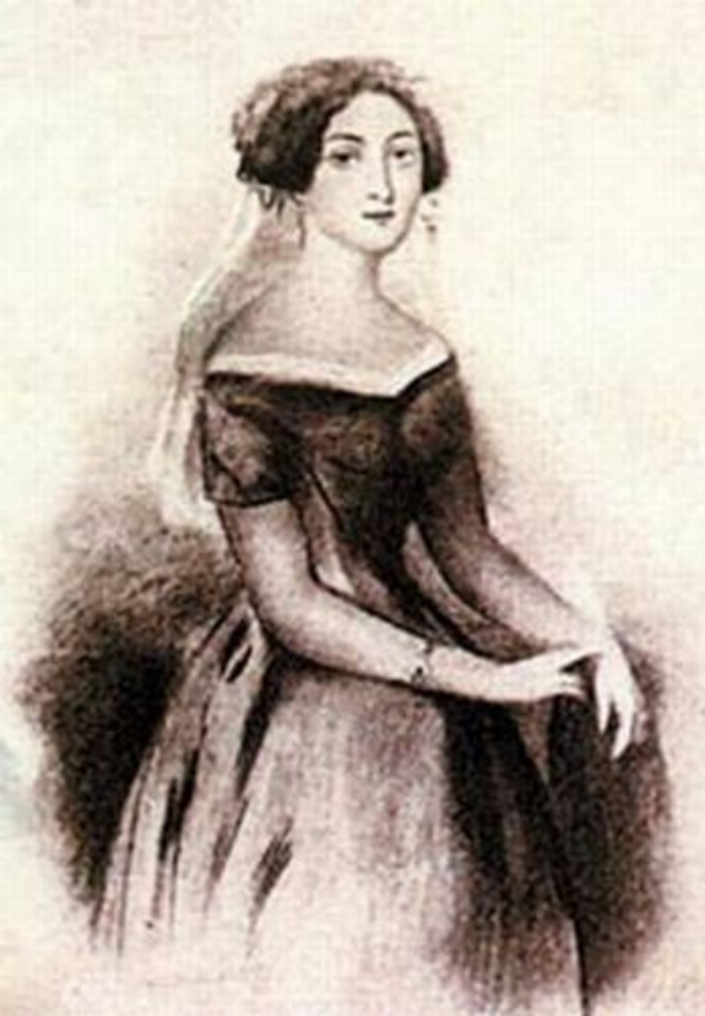
Нина Чавчавадзе, жена А.С. Грибоедова