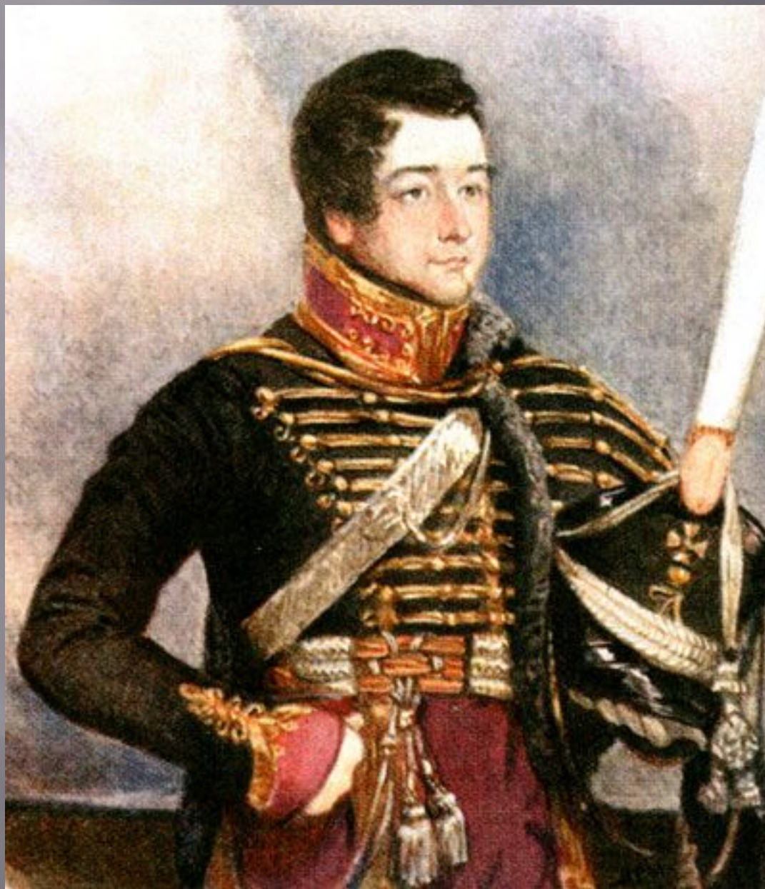
Грибоедов-гусар. 1813 год. Польша. Кавалерийские резервы.