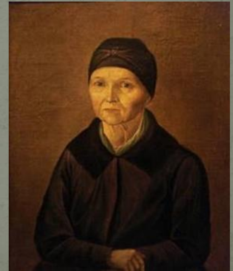
М.А. Ганнибал и Арина Родионовна