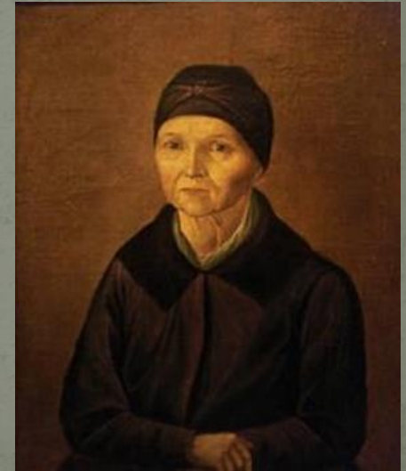
М.А. Ганнибал и Арина Родионовна