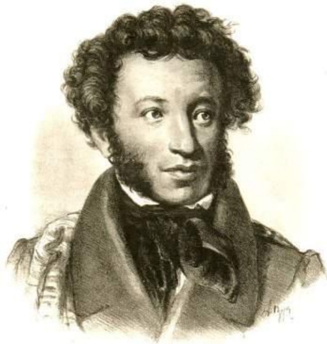
Александр Сергеевич ПУШКИН (1799—1837)