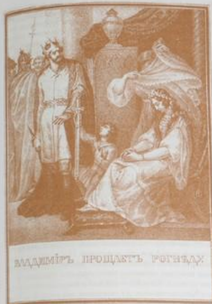
ВЛАДИМИРЪ ПРОЩАЕТЪ РОГНЕДУХЪ

Деталист не удивлялся, каким образом проповедники Вир-долженствовали говорить с Владимиром; но ежели греческий