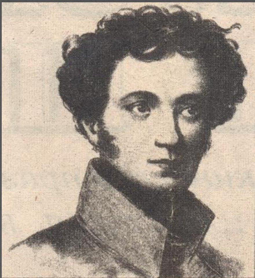
А. С. Пушкин в лицейском мундире. Литография с рисунка неизвестного художника. 1816–1817

А это сам Александр Пушкин. У него были прозвища Егоза и Француз.