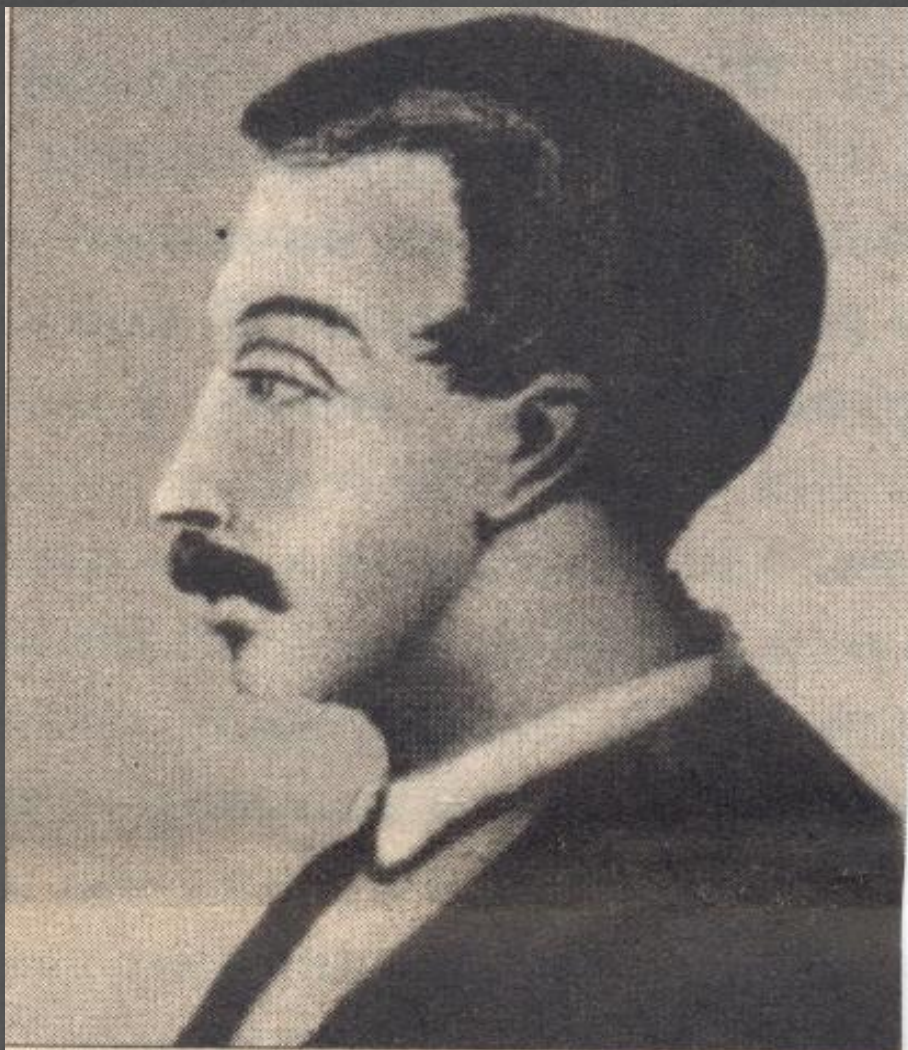
В.К. Кюхельбекер. Гравюра И. Матюшина

Это Вильгельм Кюхельбекер по прозвищу Кюхля или Бекеркюхель.