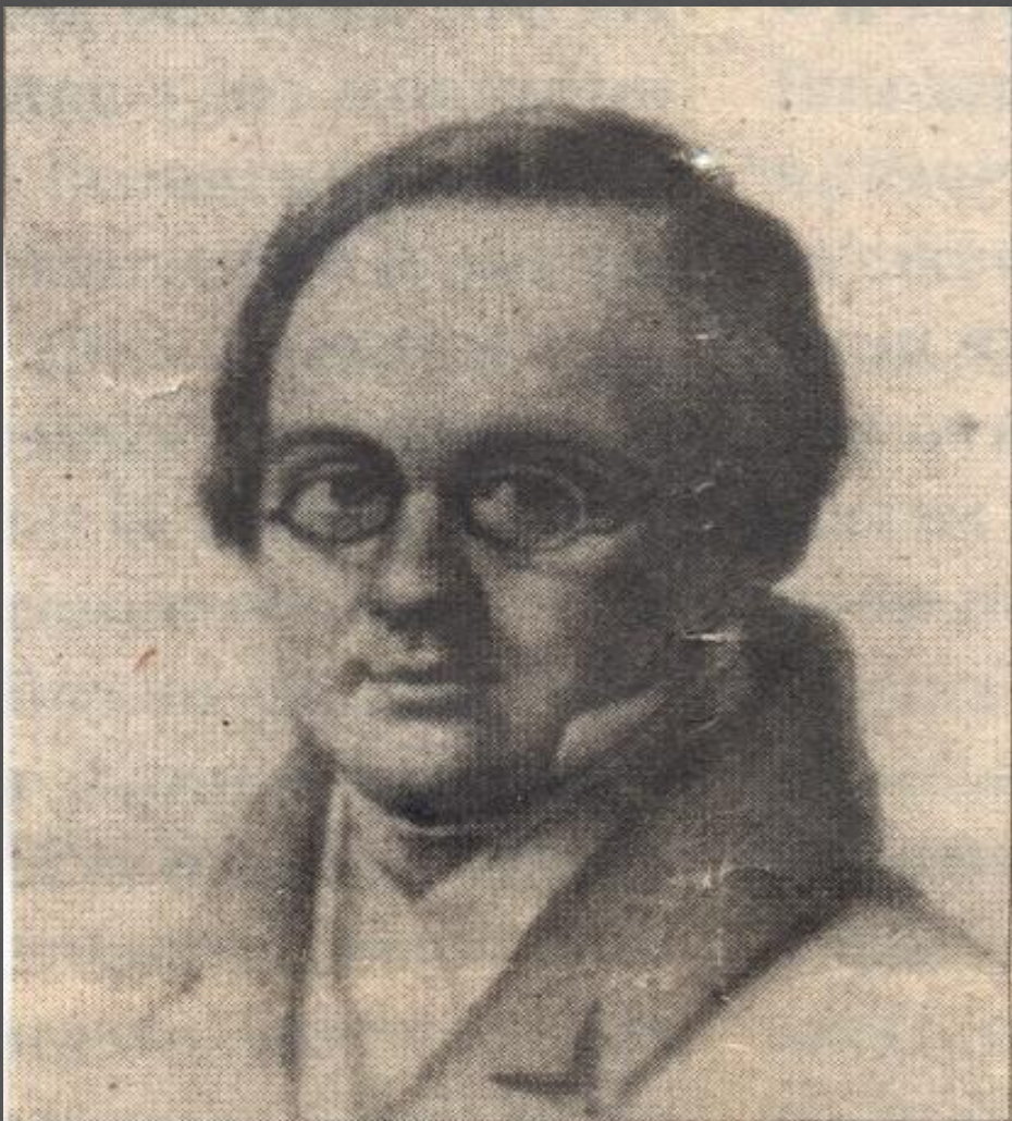
А.А. Дельвиг. Рисунок В. Лангера. 1830

Это Антон Дельвиг, по прозвищу Тося, Султан.