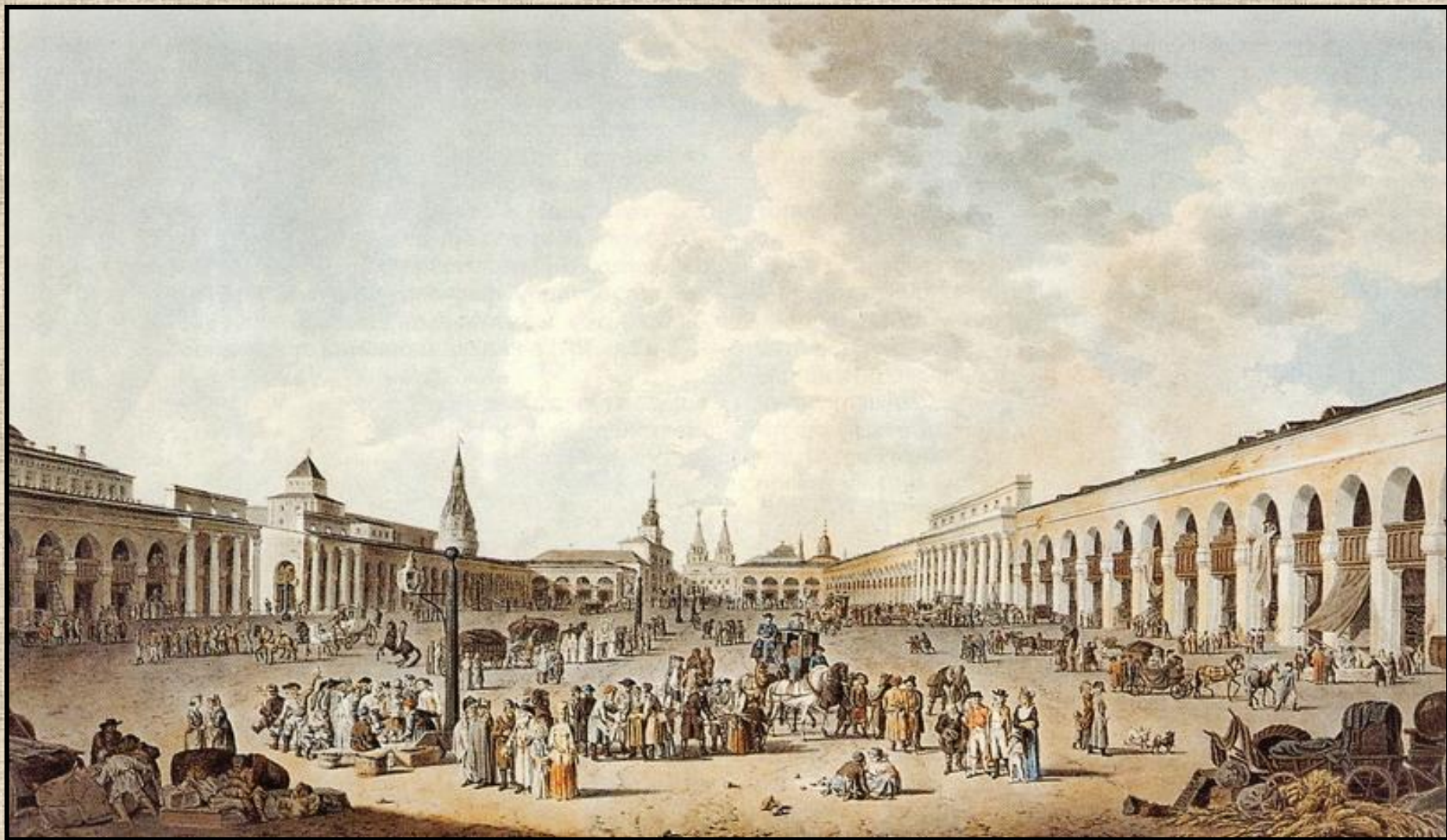
Москва, Красная площадь. XVIII век