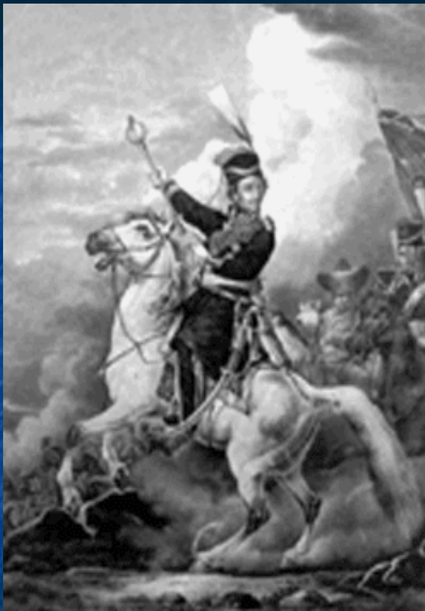
Платов Матвей Иванович