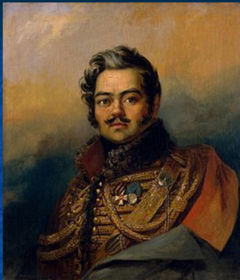
Денис Давыдов – храбрец, гусар, поэт.